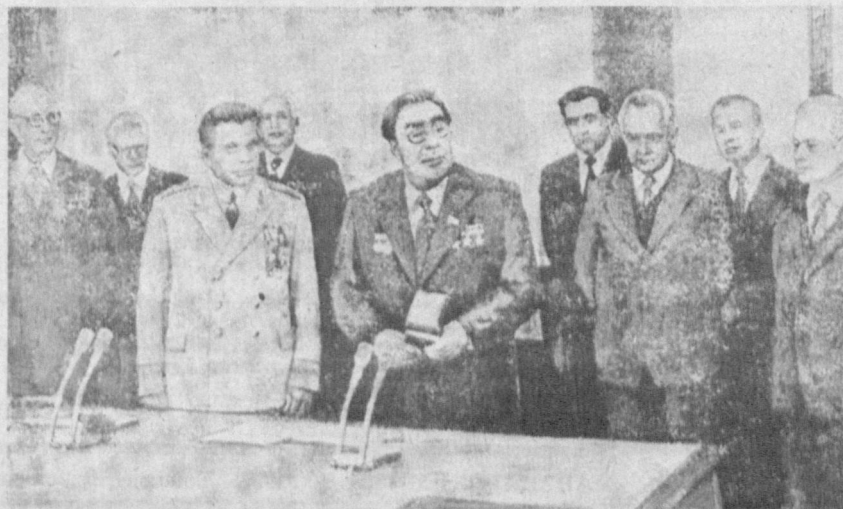
СУРАТДА: Л. Брежнев ички ишлар вазири генерал Н. Шчелоковга Социалистик Меҳнат Қаҳрамони унвонини топшираётган пайти.