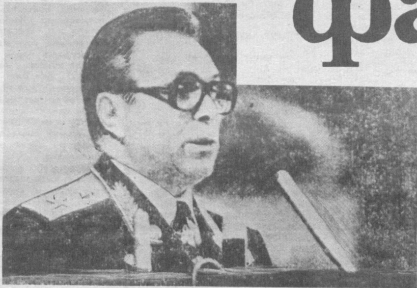
СУРАТДА: Генерал Н. Шчелоков нутқ ирода этмоқда.

Бугун ошкоралик бебаҳо неъмат эканини исботлаб ўтиришга ҳожат бормикан?! У қулоч ёзгани сари суқунат салтанатлари бирин-кетин таназулга юз тутмоқда ва илгари эл қулоғидан пинҳон тутилган маълумотлар рўзнома, ойнама саҳифаларига чиқмоқда. Фақат бир нарса — ўта кетган субтисизлик ва чегара билмаслик кишини ранжитади.