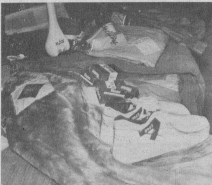
«Отчопар»нинг ўзида муҳокама қилишмоқда. 3. Автомобиль гилдиракларини ҳаммага ҳам керак, аммо нархи кишини ўйлантириб қўяди. 4. Дўкон юзини кўрмаган моллар.