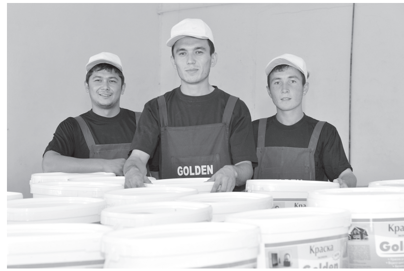
Создали хорошо оснащенные помещения для их длительного хранения.

Успешно развиваются в Сырдарье и такие направления, как животноводство, пчеловодство, виноградарство, постоянно внедряются передовые агротехнологии, модернизируется парк сельскохозяйственной техники. Фермеры, которых сегодня по праву многие называют земледельцами новой формации, успешно освоили переработку сырья, в частности, овощей и фруктов, мяса и молока.