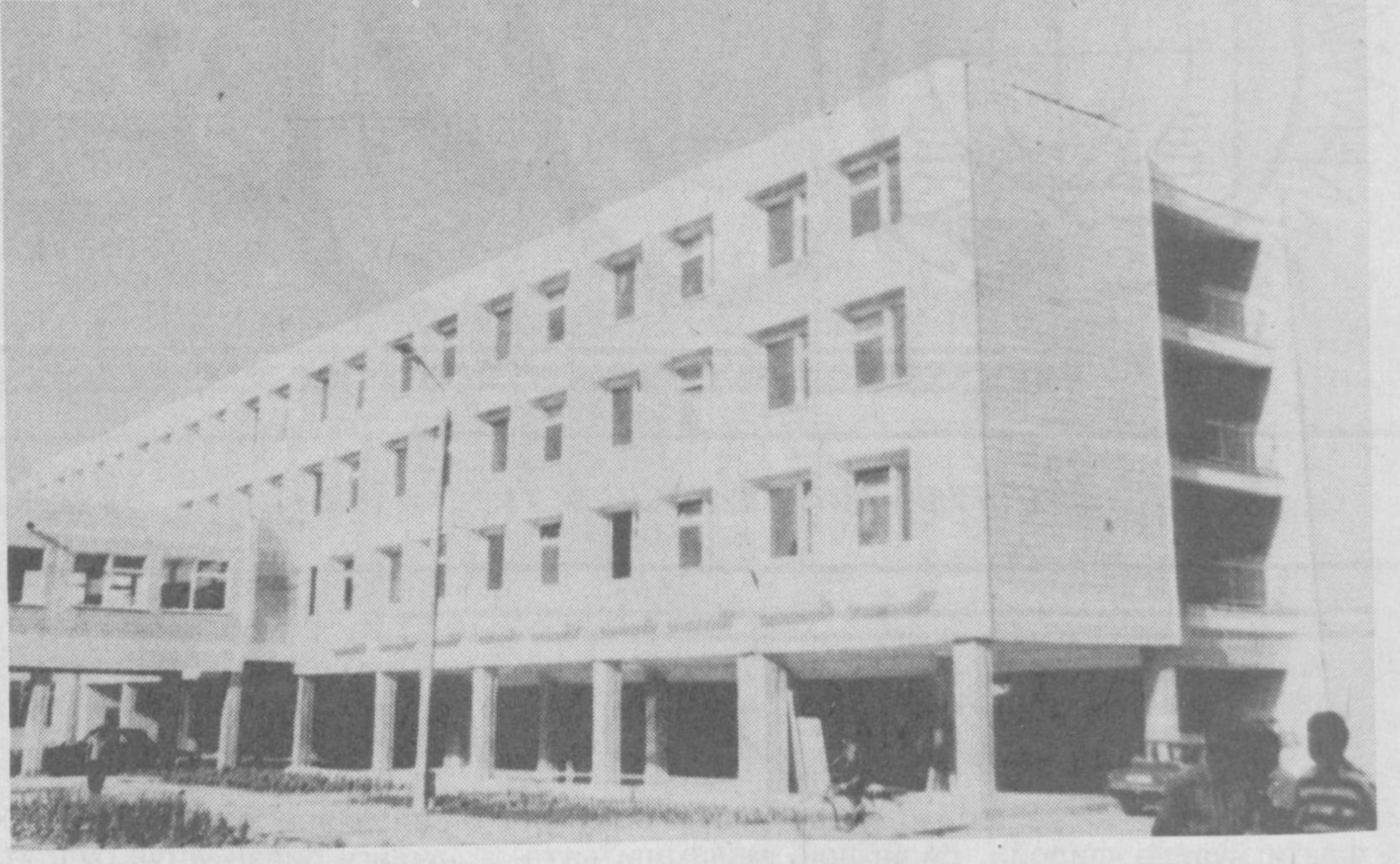
Мактаб ўқув йилига тахт.

ган педагогика жамоаларининг 85—90 фоизини муаллимлар ташкил етаятти. Натияжада синфлардаги ўқувчи-қизларнинг фаоллиги ўғил болаларга қараганда тобора олиб бораётти. Бунинг аълочи, фаол ўқувчи қизлар эртага ҳозирги авлод муаллимларни урнини тулдиришига шак-шубҳа йўқ. Бунинг нимаси ёмон? — дея эътироз билдирувчилар ҳам топилади, албатта. Тажрибали устоз-ўқитувчиларнинг ҳаётий, педагогик қузатиш — тажрибаларидан шу ҳақиқат аён. Муаллима-