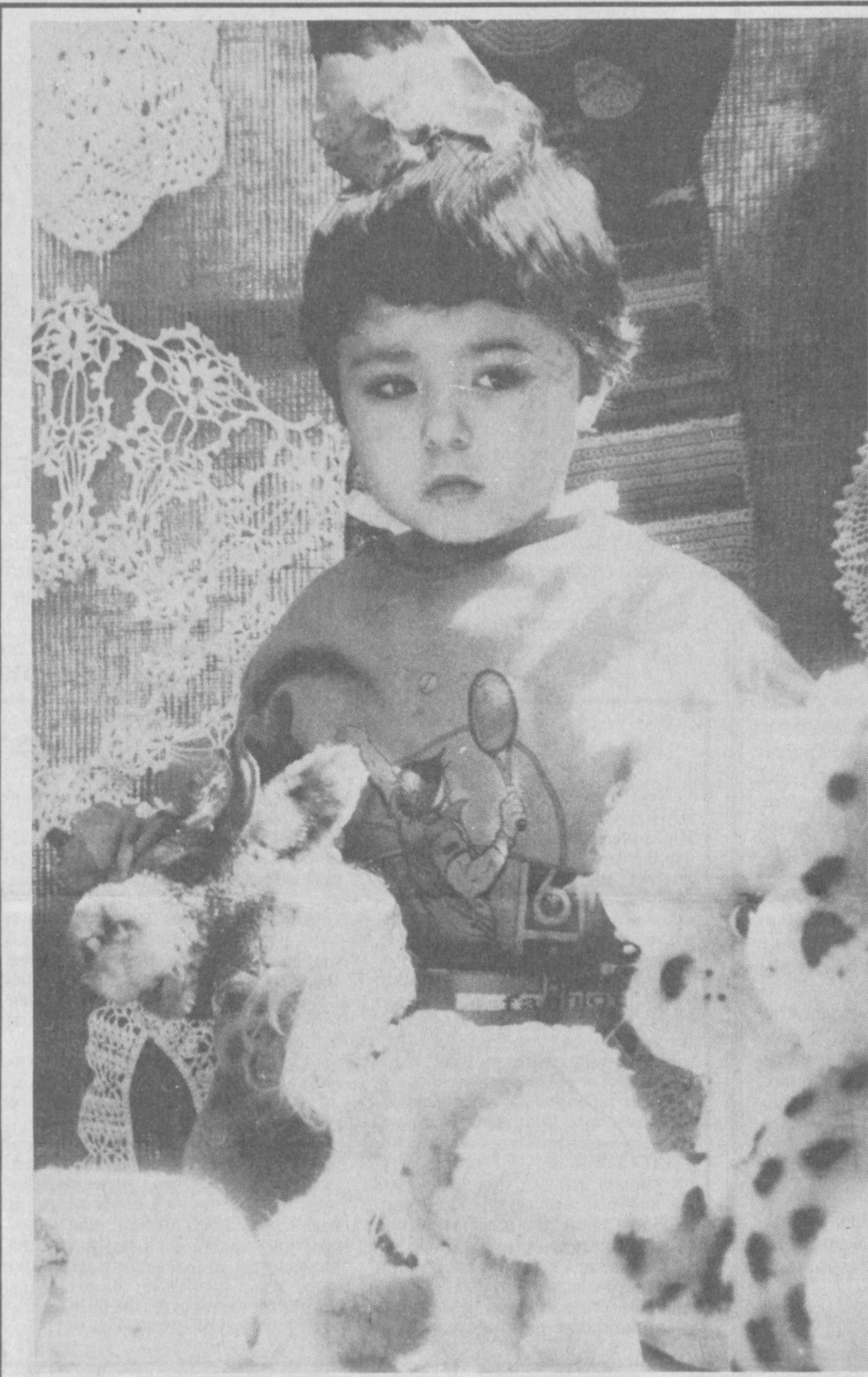
Кизим, чарос кузларинг хайрон...