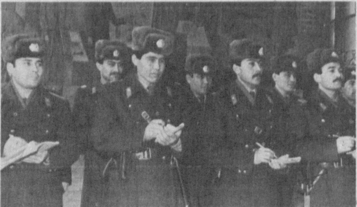
Тошкент шаҳар ИИБ пост-па трул хизмати ходимлари ўз зиммаларидаги вазифаларини сидуидилдан адо этиб келмоқдалар.