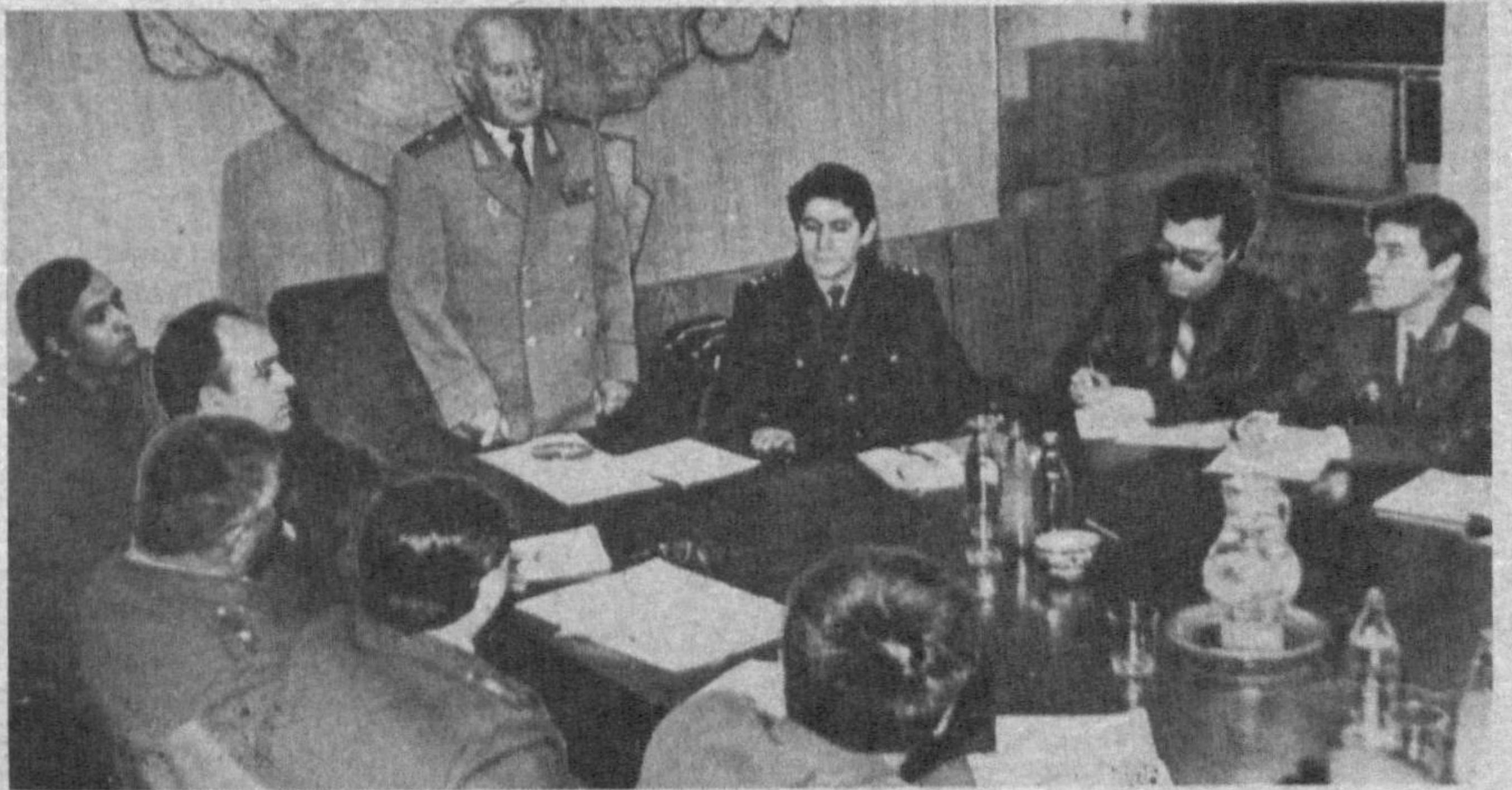
Суратда: "Давра столи" иштирокчиларининг бир гуруҳи.

Учрашув сўнггида участка вакиллари ички ишлар идораларида фаолият кўрсатаётган барча ҳамкасбларига мурожаатнома қабул қилишди. Шунингдек, улар республика Президенти И. А. Каримов номига мактуб йўллашди. Газетамизнинг 2-ва 3-саҳифаларида ана шу материаллар билан танишасиз.