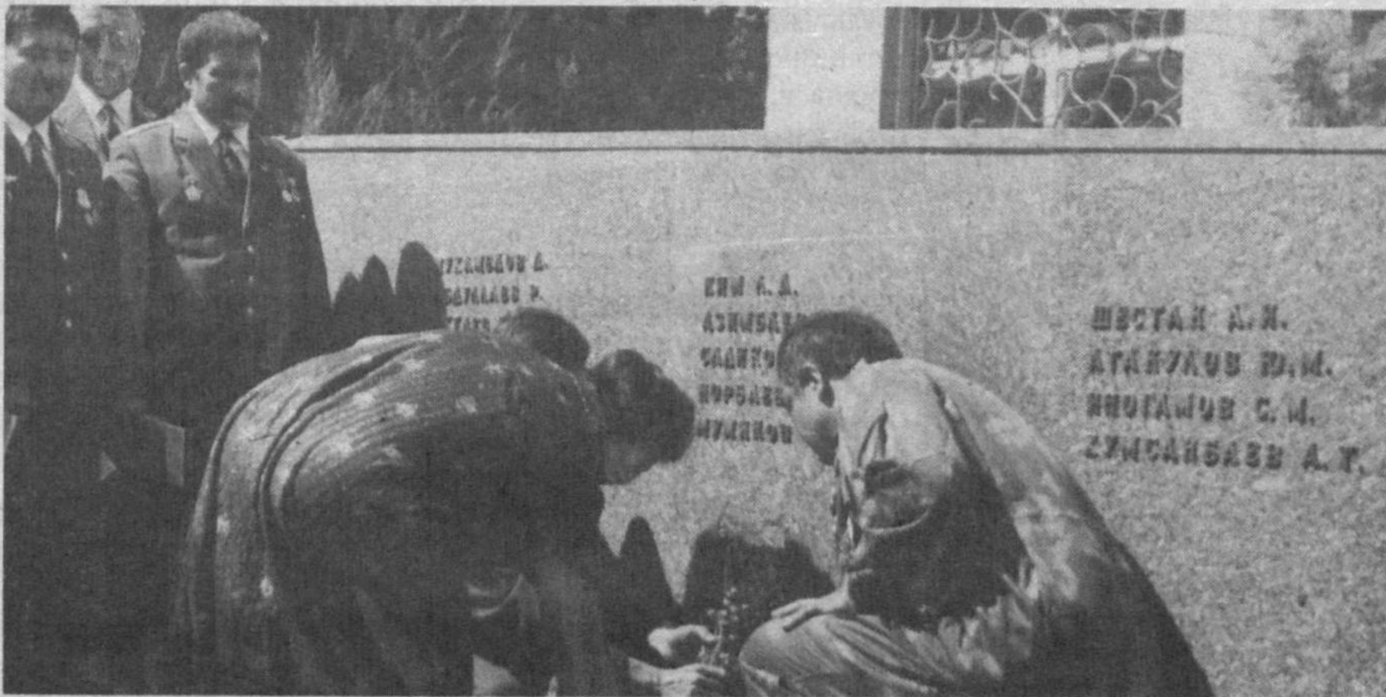
Ушбу мрамартошга ўттиз битта шахид кетган мард инсоннинг исму шарифи ўйиб ёзилган. Уларни хар йили, ҳар доим ёдга олишади, зиёрат қилишади. Зотан, элимнинг тинчи дея жон фидо қилганлар ҳеч қачон унутилмайди.