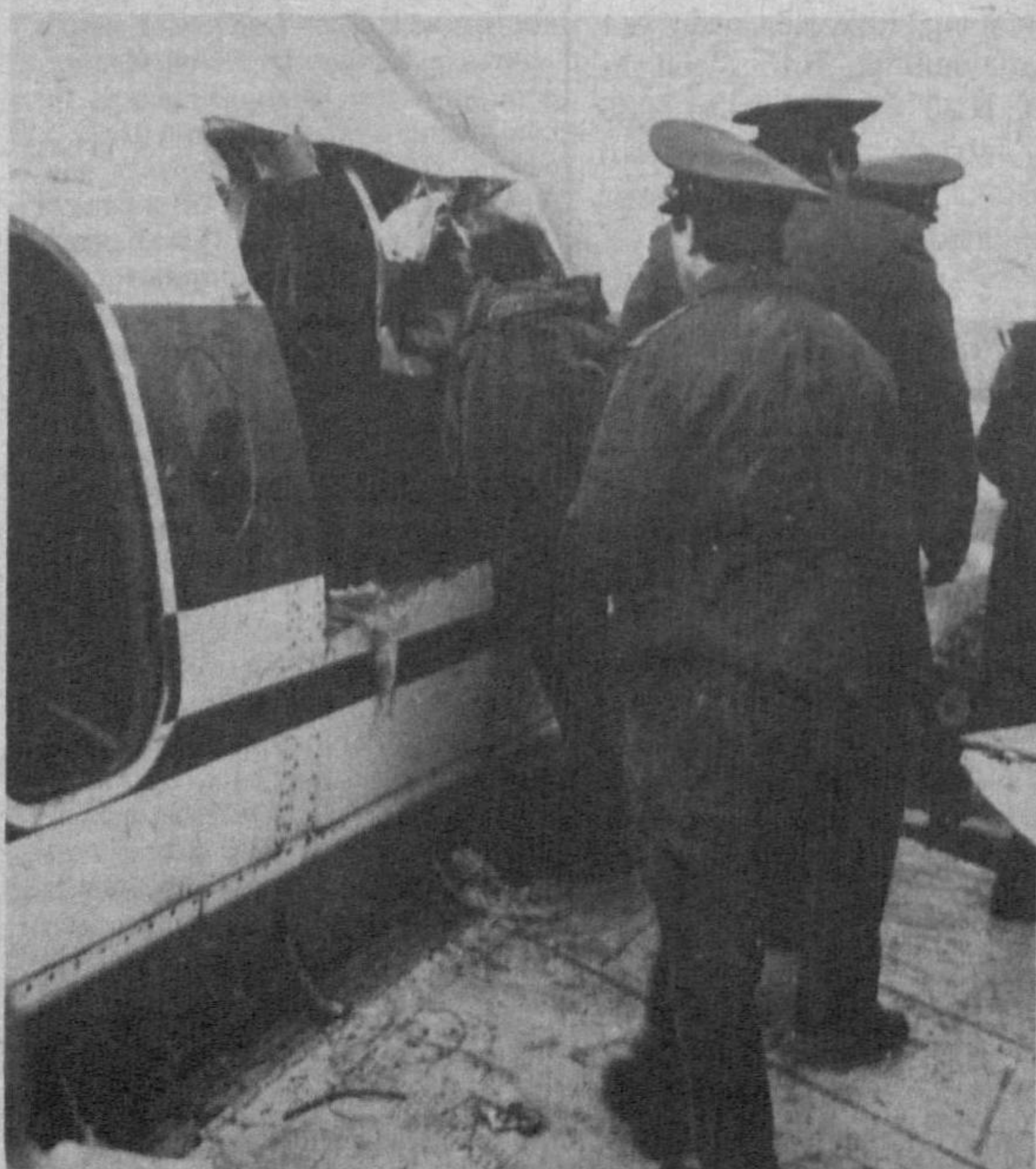
СУРАТЛАРДА: МАШҒУЛОТЛАРДАН ЛАВҲАЛАР.