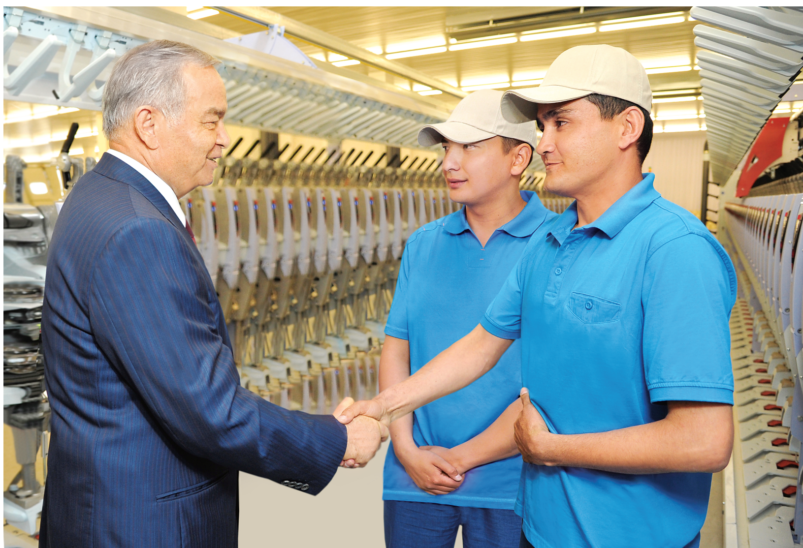
Президент Республики Узбекистан Ислам Каримов с целью ознакомления с ходом осуществляемых на местах социально-экономических реформ и созидательной работы 19 июня посетил Джизакскую и Сырдарьинскую области.

Как и по всей стране, в Джизакской области обеспечиваются устойчивые темпы роста, достигаются высокие результаты в развитии всех сфер. Подтверждение тому можно видеть и на примере больших успехов, которых добиваются трудящиеся области. В частности, в первом квартале этого года рост валового регионального продукта составил 9,7 процента, производства в области промышленной продукции — 9,3, сельскохозяйственной продукции — 5,9, объема строительных работ — 11,6, оказания платных услуг — 10,7 процента. В соответствии с программой социально-экономического развития области в 2013—2015 годах намечена реализация 2 061 проекта, в том числе в 2013 году — 1 381 проекта.