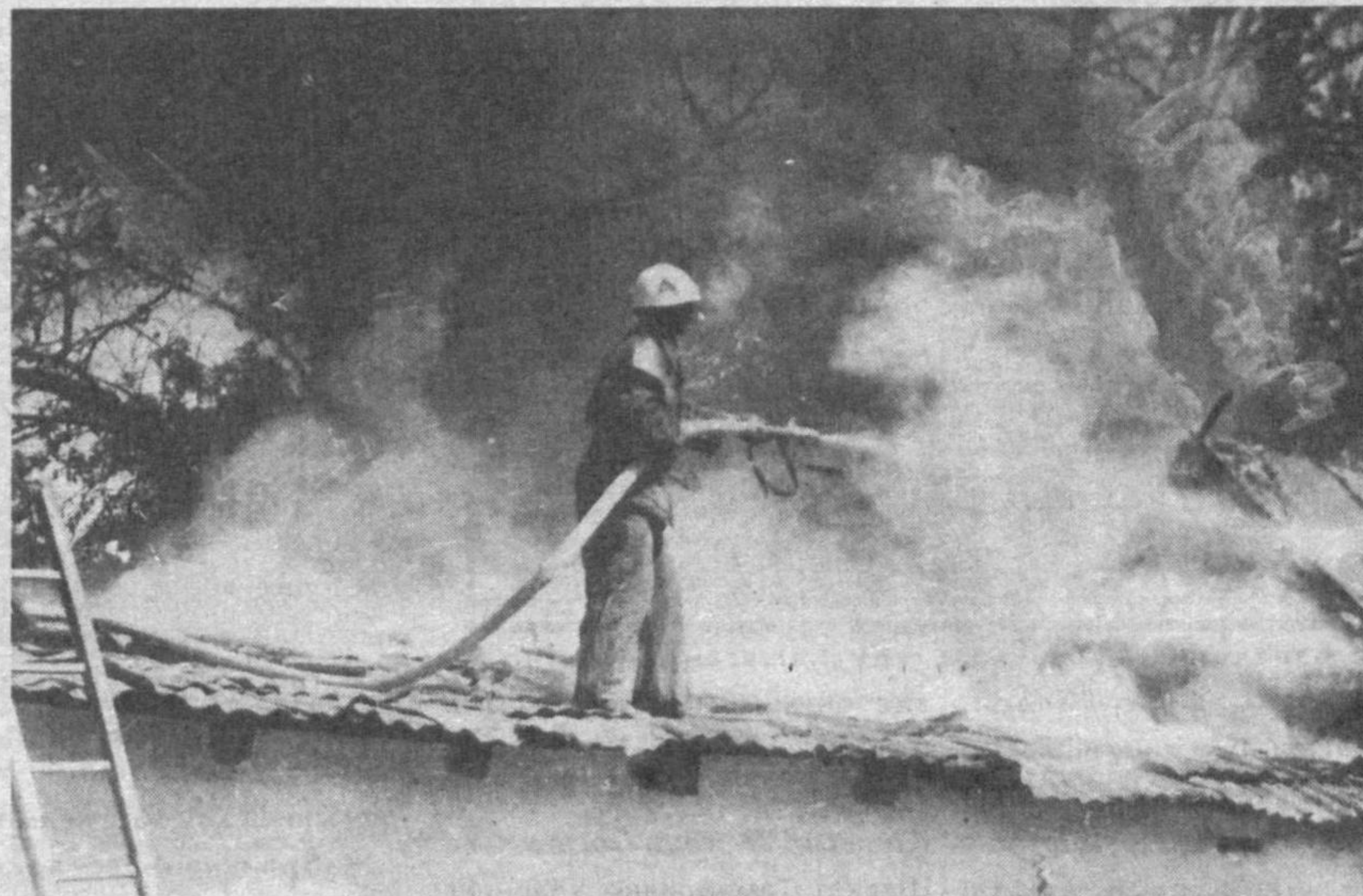
• Ўт билан олишув

Эллик йил... Ҳаётнинг ёзилмаган қонунларига кўра, бу муддат инсон умрининг ярми ҳисобланади. Ёки умр йўлининг катта бекати десак ҳам янглиш бўлмайди. Демакки, ўтган