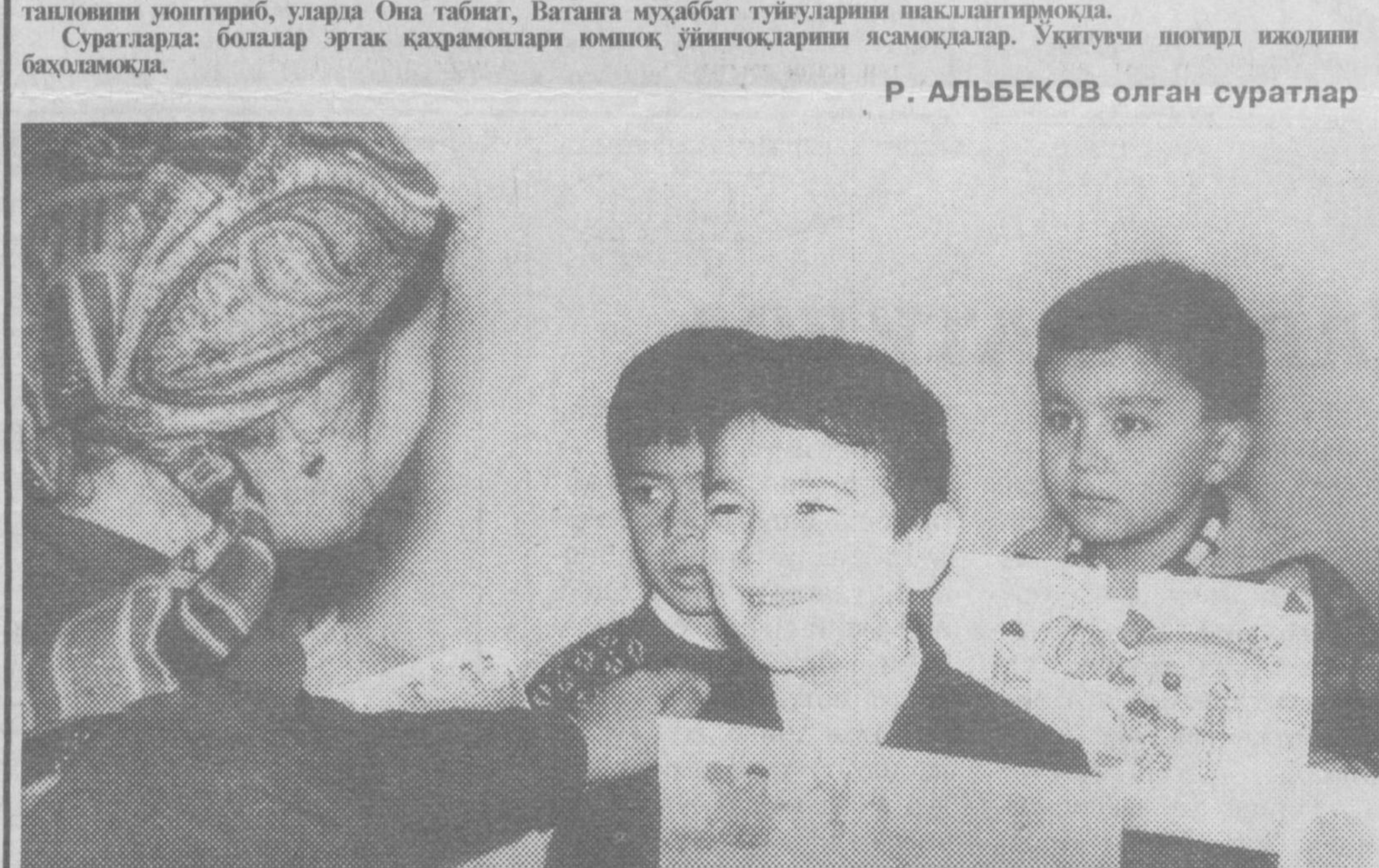
Суратлар: эртақ қаҳрамонлари юмшоқ ўғинларнинг...