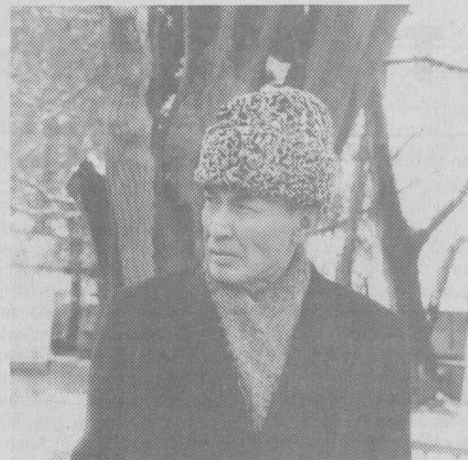
* Абдулла ОРИПОВнинг «Январь» шеъри асосида Абдул Фани ЖУМА тайёрлаган сурат-лавҳалар