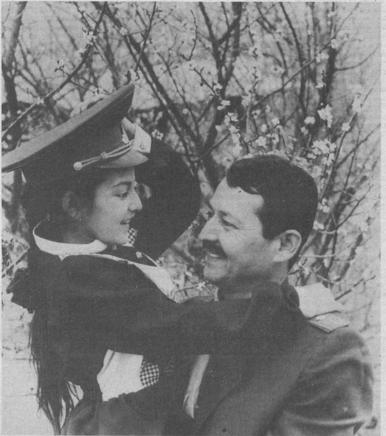
- Адажон, сизга ҳавасим келяпти!