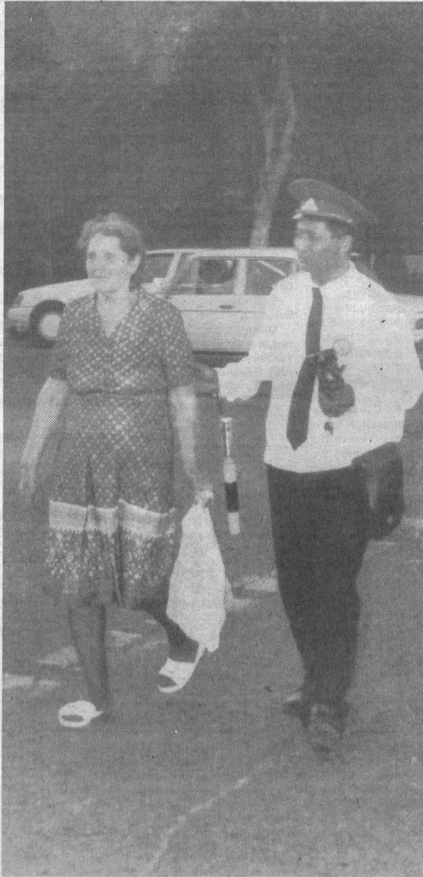
— БИР-БИРИМИЗГА МЕҲР-ОҚИБАТЛИ БЎЛАЙЛИК!

Шунинг учун ҳам ҳар бир газетхонга, фуқароларга, саломатлигинизни асранг, дардга чалиниб қолсангиз тезда даволатинг, деб маслаҳат бераман. Зеро, мамлакатимиз фуқаролари соғ-саломат бўлса, оилалар мустаҳкамланади, соғлом авлодлар етишади.