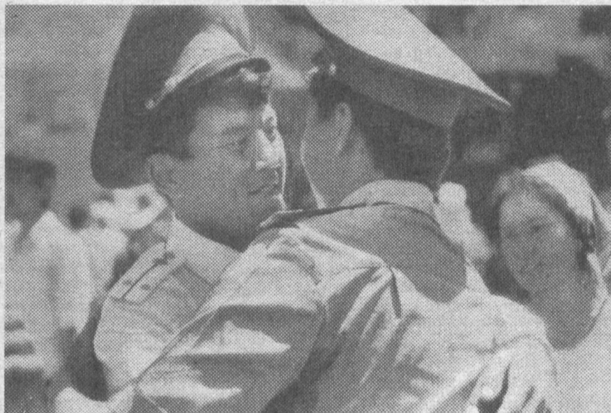
— Биз хизматга шаймиз!