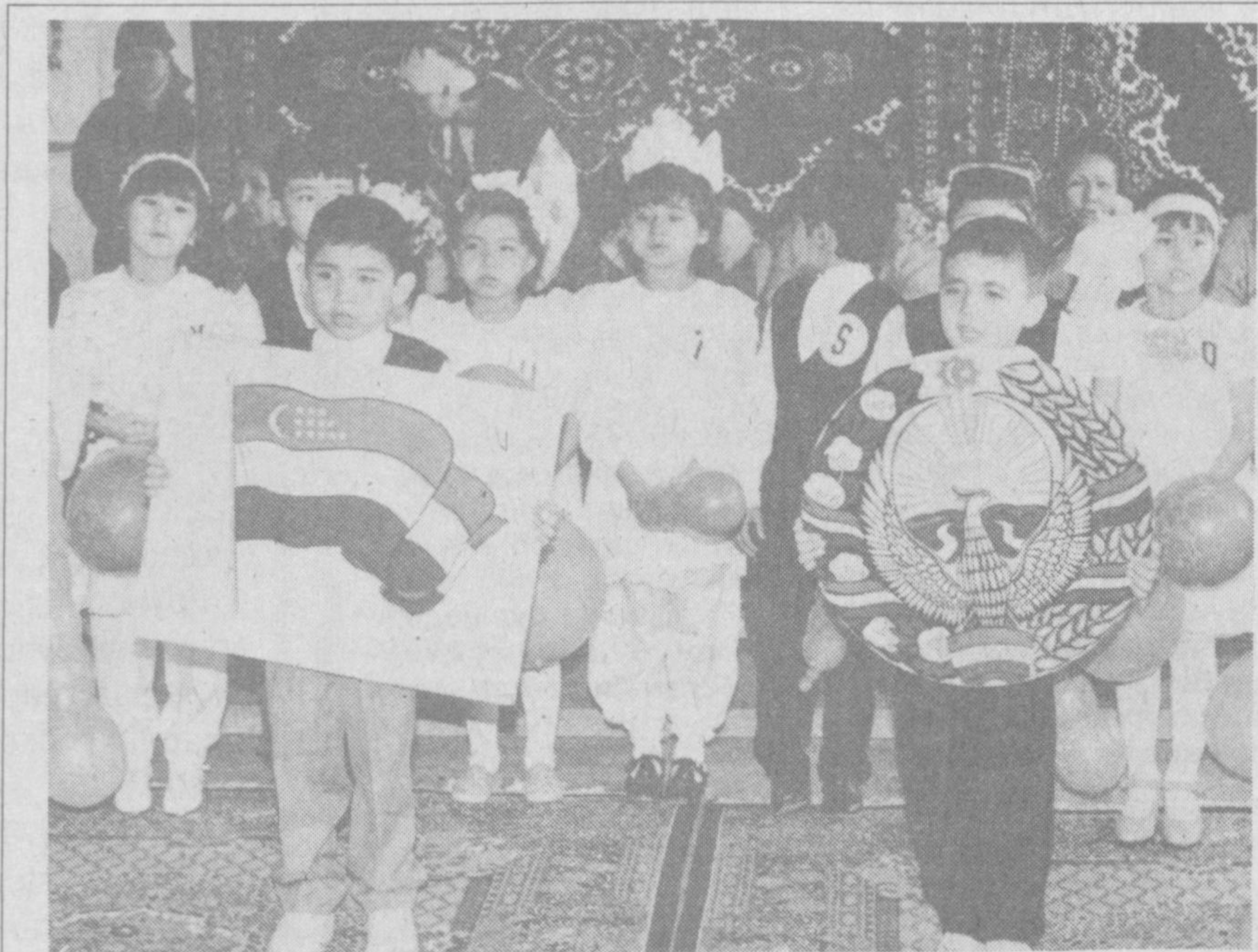
Олмалиқ шаҳридаги 19 - ўрта мактабда 1 «Е» синф ўқувчиларининг аъъанавий саводхонлик байрами бўлиб ўтди. Даврага кўзларни кўнатиб, дилларни яйратиб, жажжи киниктойлар кириб келишди. Уларни ота-оналар, ўқитувчилар, мутахассислар ҳаяжон билан қутиб олишди. Болалар озод ва хур диёримизни мадҳ этувчи шеърлар ўқиди. Байрам сўнггида эса, йиғилганлар кичкинтойлар муаллимаси Р. Алиқулловага миннатдорчилик изхор қилдилар. Суратда: саводхонлик байрамидан лавҳа.

• Ўзбекистон Республикаси Президенти Ислам Каримовга Кувейт давлатининг мамлакатимиздаги Фавқулодда ва Мухтор элчиси этиб тайинланган Фавзий Абдулазиз ал-Жосим, Замбия Республикасининг Ўзбекистон Республикасидаги Фавқулодда ва Мухтор элчиси этиб тайинланган Франсис Гершум Симамб ишонч ёрликларини топширишди.