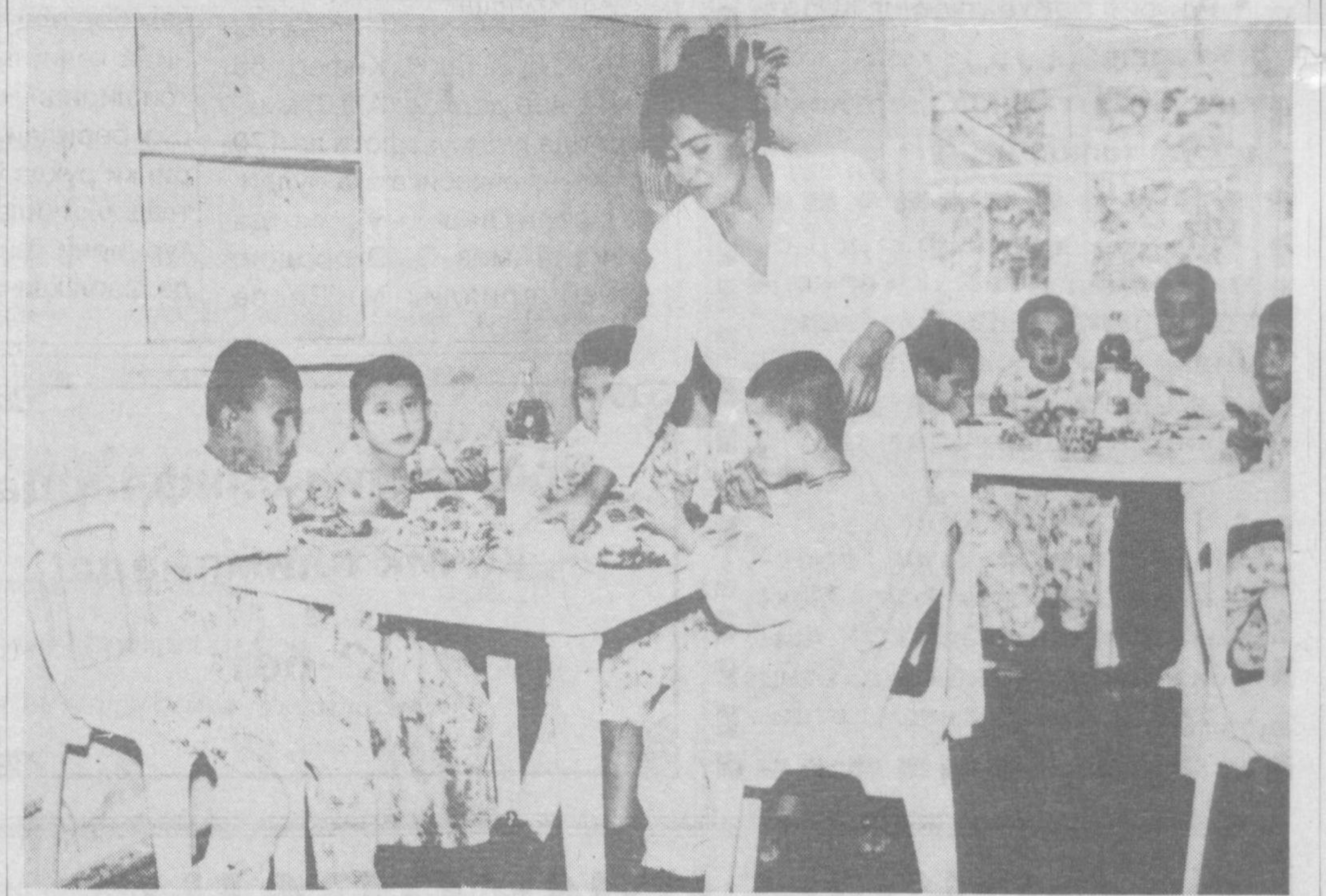
Яқинда ҚиҒрай туманидаги Республика болаалар полиомелит шифохонасида меҳрмуруват байрами ўтказилди. Тантанана Н.Х.Икнатов раҳбарлигидаги «Бахт назир» МЧЖ жамоаси бош-қош бўлди. Тадбир бу ерда давоаланган юздан ортққ болалар қаҳбида катта таасурот қолдириди. Суратда тантанадан лавҳа акс этган.

кўпаяётгани қувонарли ҳолдир. Бундай саъй-ҳаракатлар ҳукуматнинг халқ таълимини ривожлантириш соҳасидаги ички сиёсатининг амалга оширига кўрсатилмаётган ёрдам бўлиб, келажда ўзининг меvasини беради. Аваз ҲАЙДАРОВ, ўз муҳбиримиз