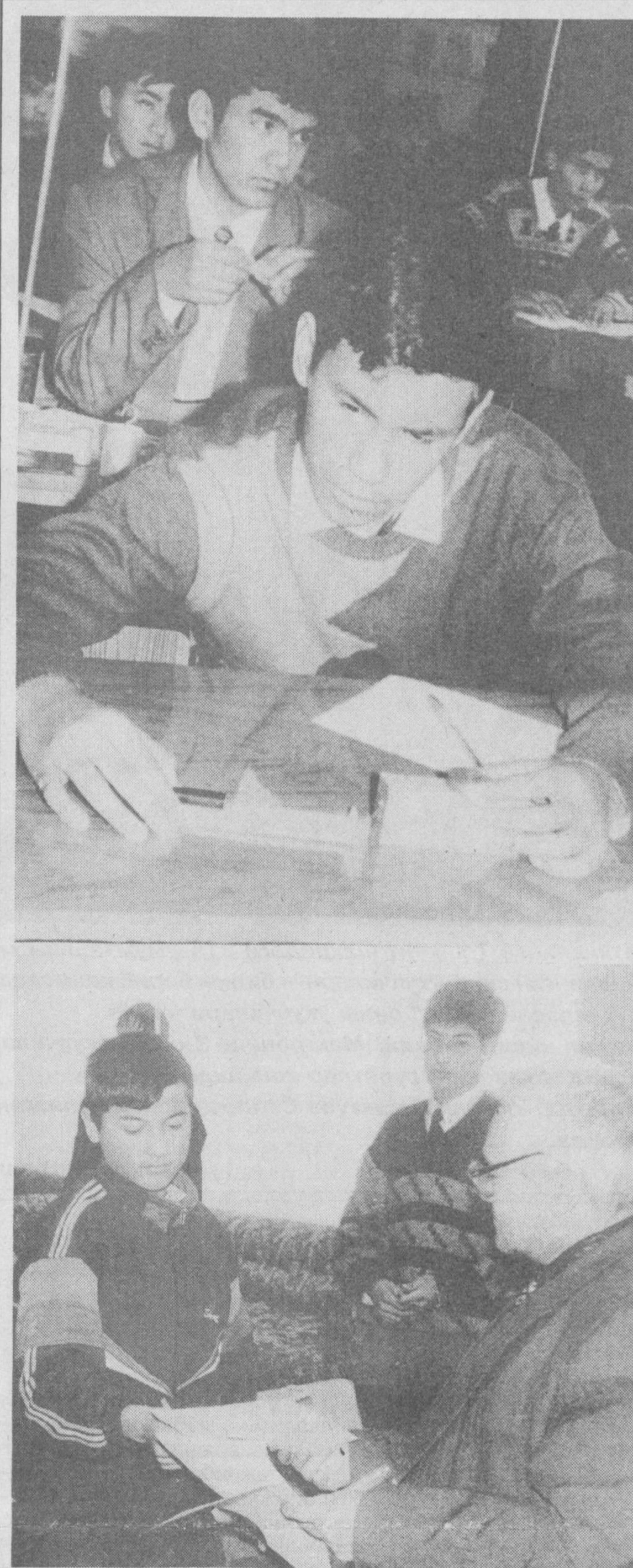
Яқинда физика фанидан Республика ўқувчиларининг олимпиадаси бўлиб ўтди. Унда мамлакатимизнинг турли мактабларидан келган ўқувчилар ўз bilim ва маҳоратларини қизгин намойиш этишди. Суратларда: олимпиада жараёнидан лавҳалар акс этган.