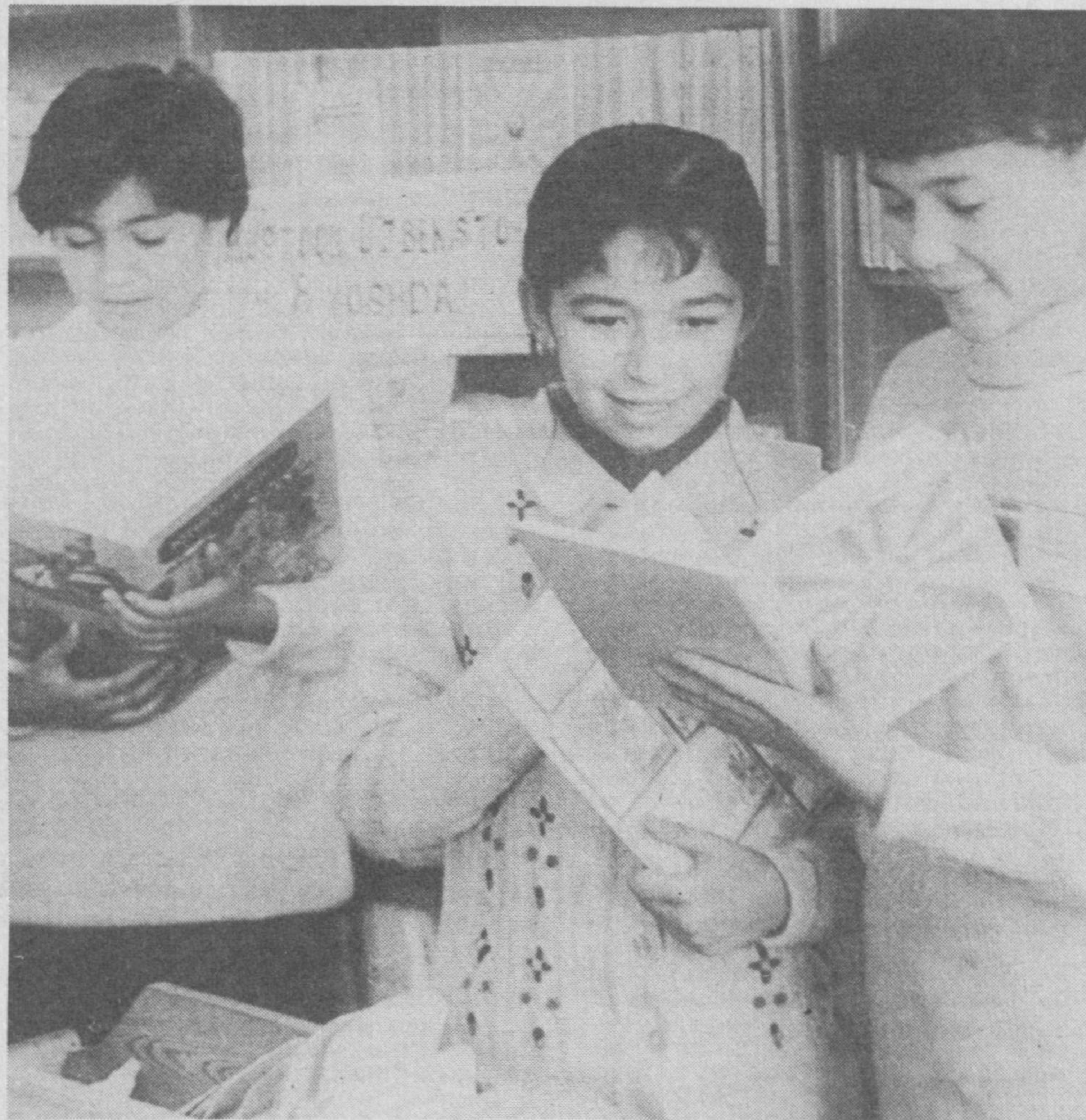
Билимли ёшлар — муносиб ворислар