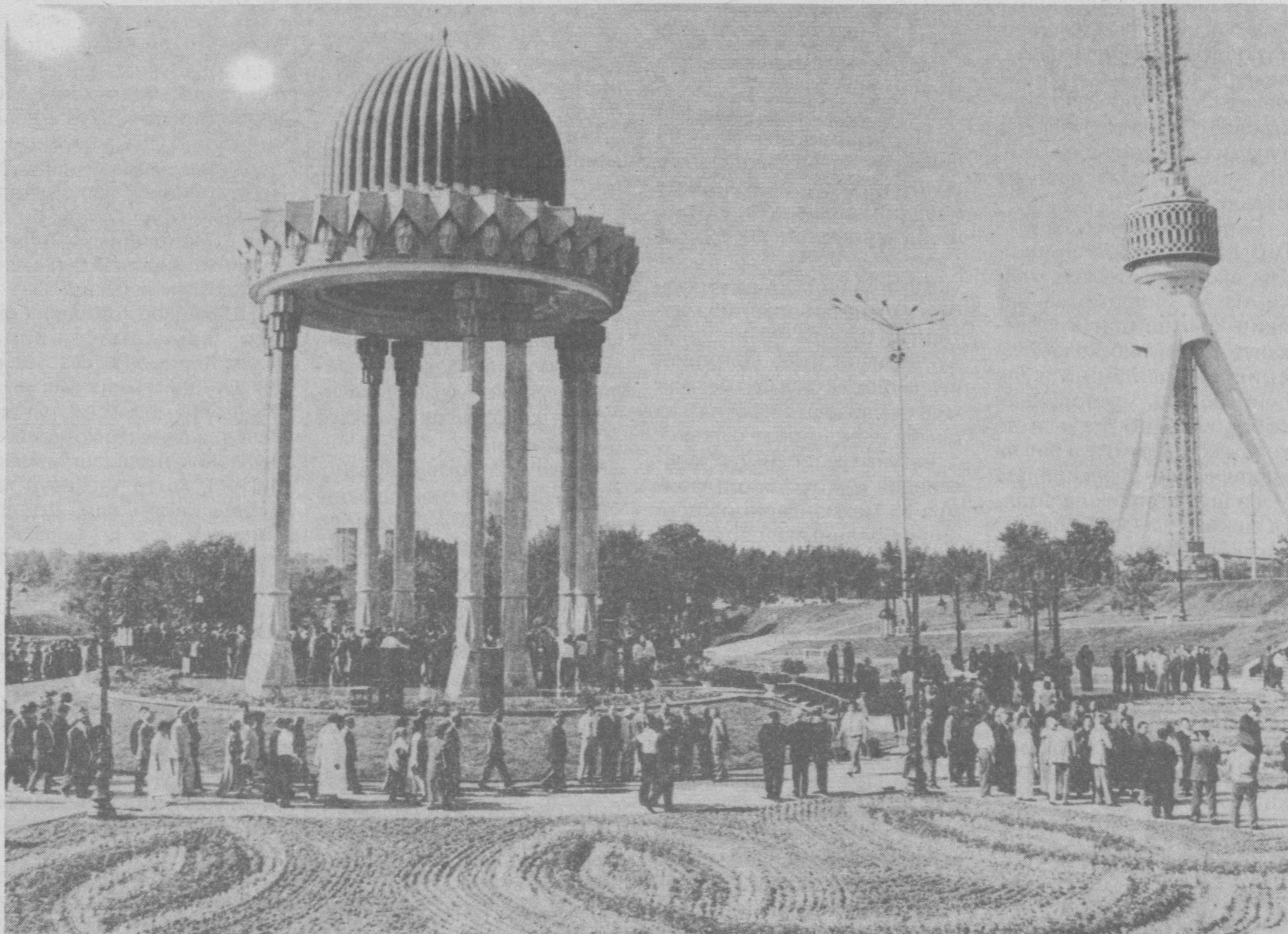
Суратларда: маросимдан лавҳалар.