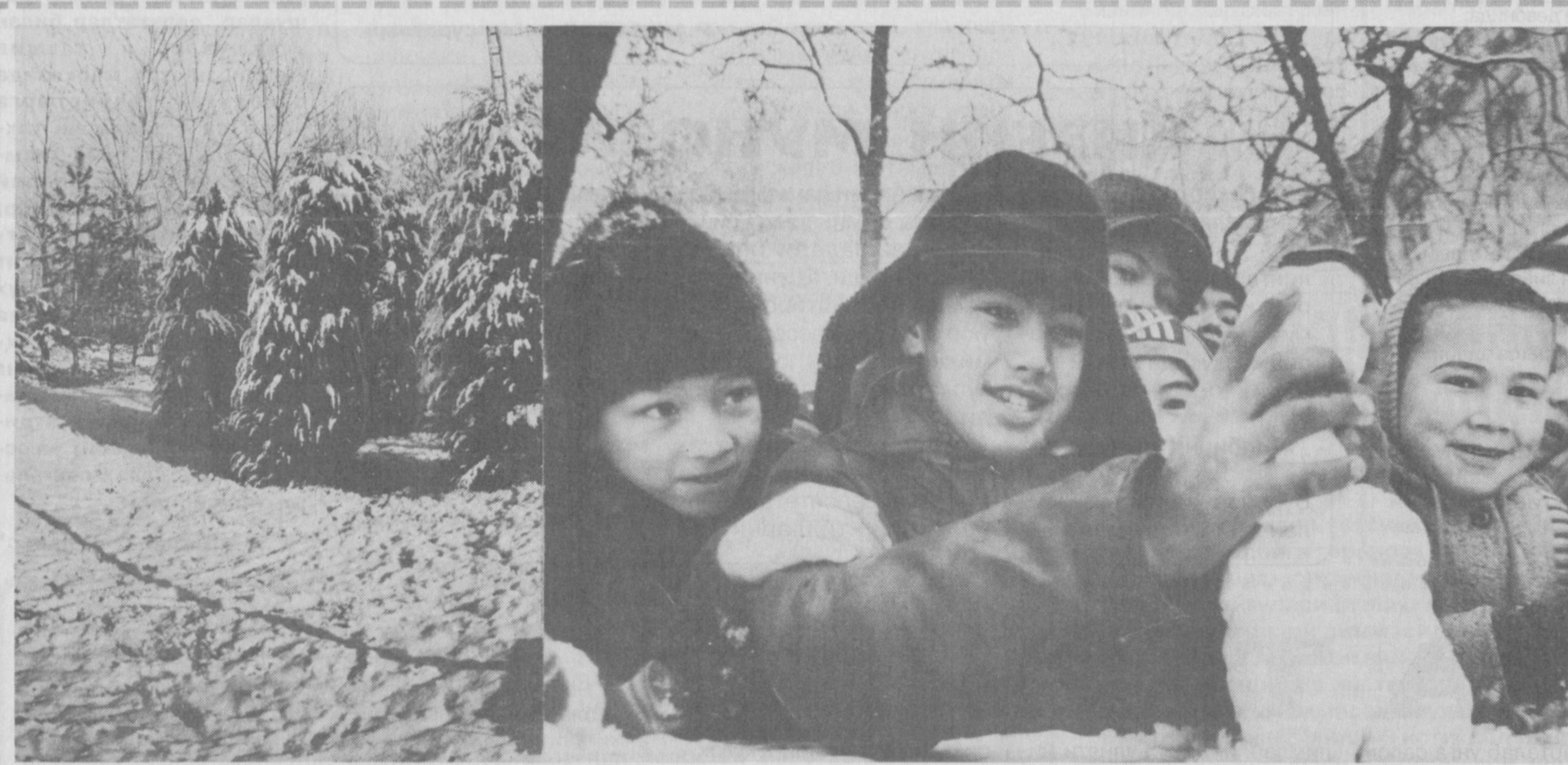
Хайрият, қор ёғди...