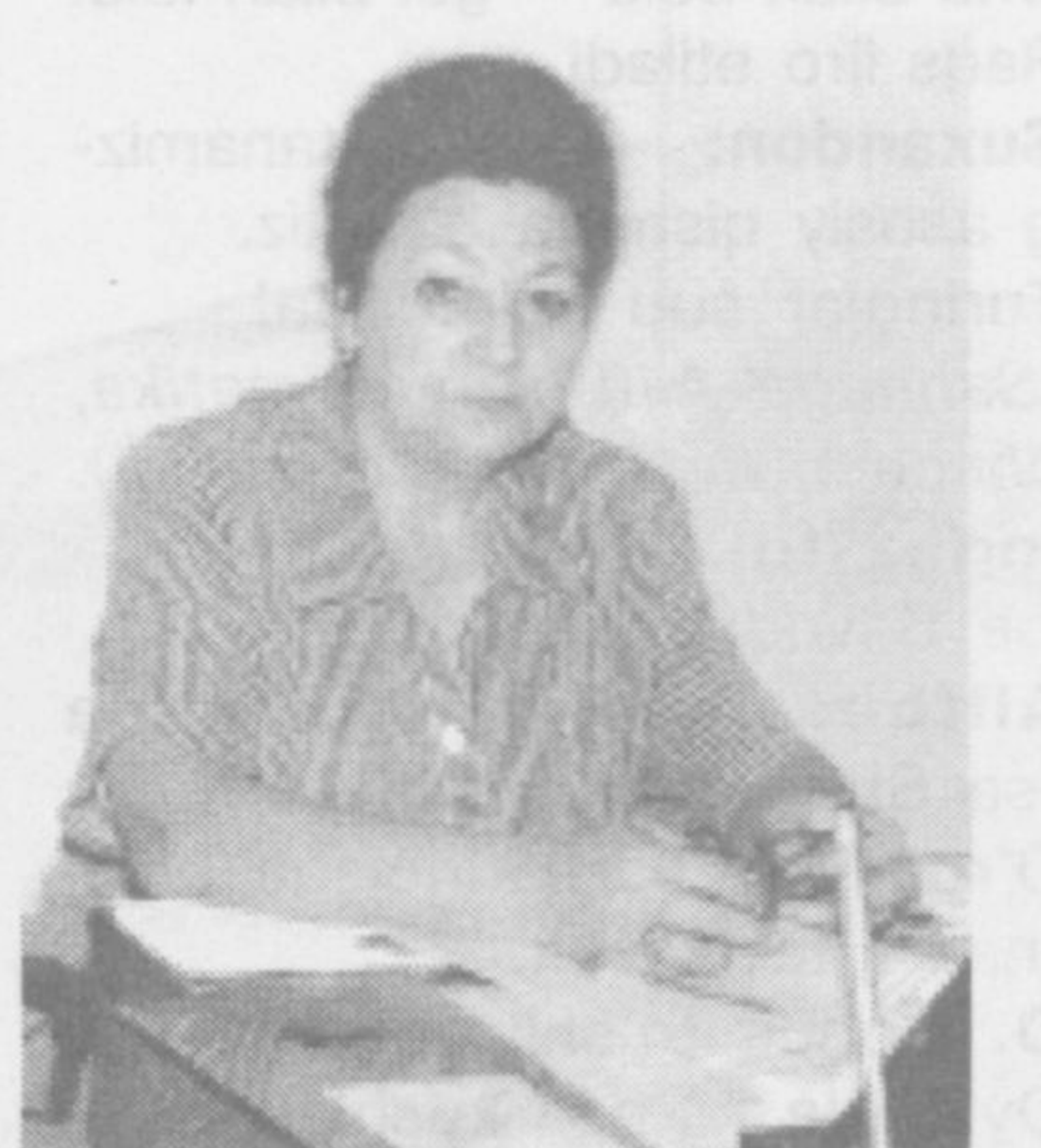
Сирдарё вилояти халқ таълими бошқармаси ҳамда унинг жойлардаги бўлимлари томонидан "Кадрлар тайёрлаш миллий дастури" вазифаларининг бажарилишини доимий назорат қилиш мақсадида унинг доимий мониторинги олиб борилмоқда. Аввало, таълимнинг илк босқичи ҳусусида сўз юритилган бўлса, вилоятда фаолият кўрсатаётган 182 та мактабга таълим муассасасида 18468 нафар болалар таълим тарбия олмақда. Бу эса мактабга ёшдаги болаларнинг 19,5 фоизини ташкил этади. Амалга оширилган чора-тадбирлар натижасида мактабга таълим муассасаларига болаларни тортиш фаолияти улар тармоғининг камайиш ҳолати тўхтатилган.