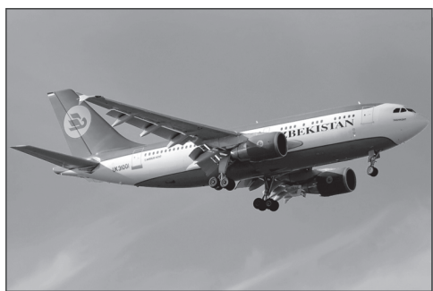
Самолет пассажирский А310 трехклассной компоновки (3 шт.)

В связи с унификацией самолетно-моторного парка Национальная авиакомпания «Узбекистон хаво йуллари» предлагает к продаже авиационную технику: