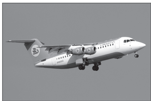
Самолет RJ-85 (3 шт.)

А также продолжается программа реализации авиационной техники типа ТУ-154М, ТУ-154Б, ИЛ-76ТД и соответствующих авиадвигателей.