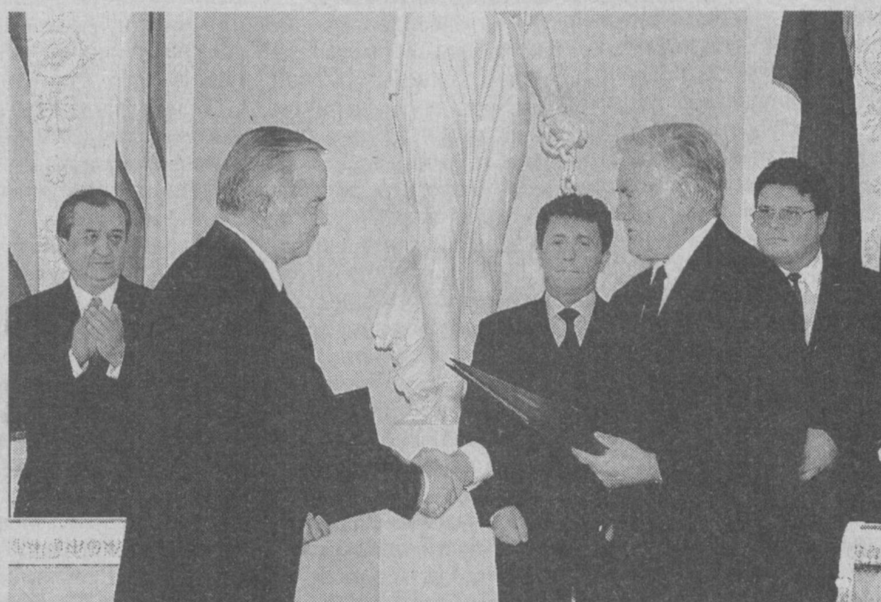
24 сентябрь. Вильнюс. (ЎЗА махсус мухбири Анвар Бобоев хабар қилади).

Литва Президенти қароргоҳида Ўзбекистон Республикаси Президенти Ислам Каримовни расмий кутиб олиш маросими бўлди. Юксак мартабали меҳмон шарафига фахрий қоровул саф тортиди. Икки давлат мадҳиялари янгради.