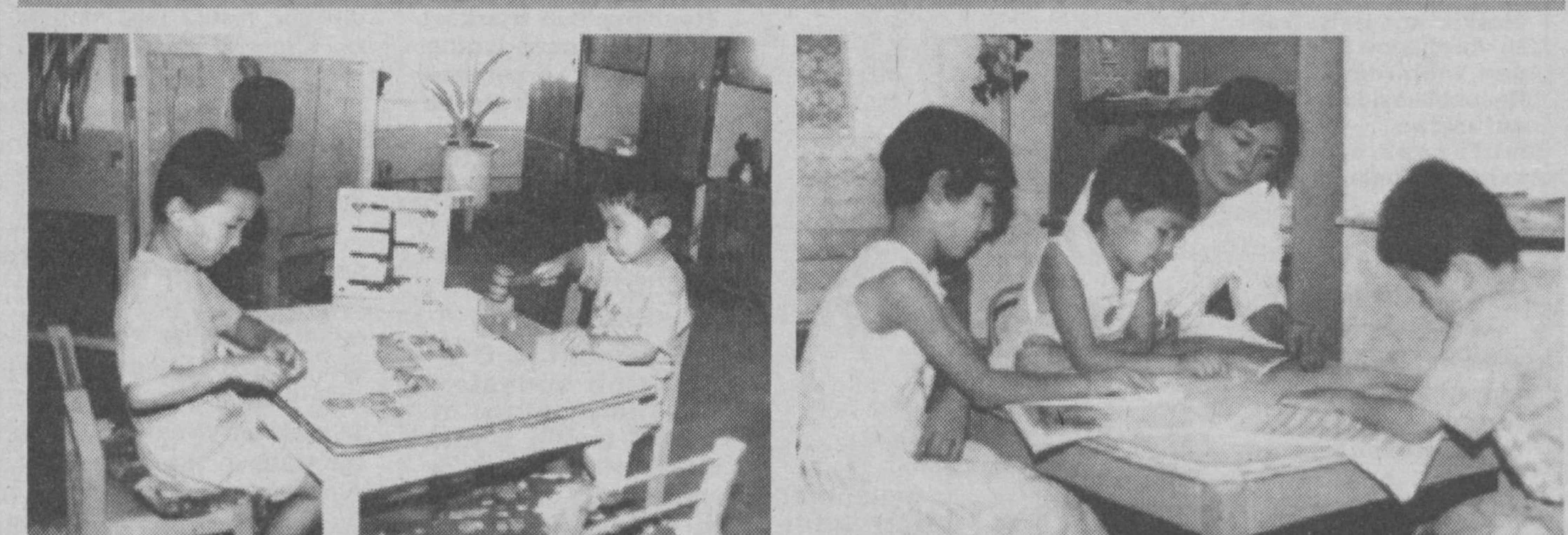
Стул атрофида тўпланиб ўтирган болалар бир-бирларига қизиқиб, марок билан китоб ўқийдилар ёки турли шакллари ясайдилар. Агар бола ёлғиз бўлса-чи? Ундаги қизиқиб туйғуси йўқолиб, ўрнини зерикчи ҳисса эгаллайди. Бола тарбиясида ушбу усул яъни биргалишиб ҳаракат қилиш муҳим аҳамиятга эга.