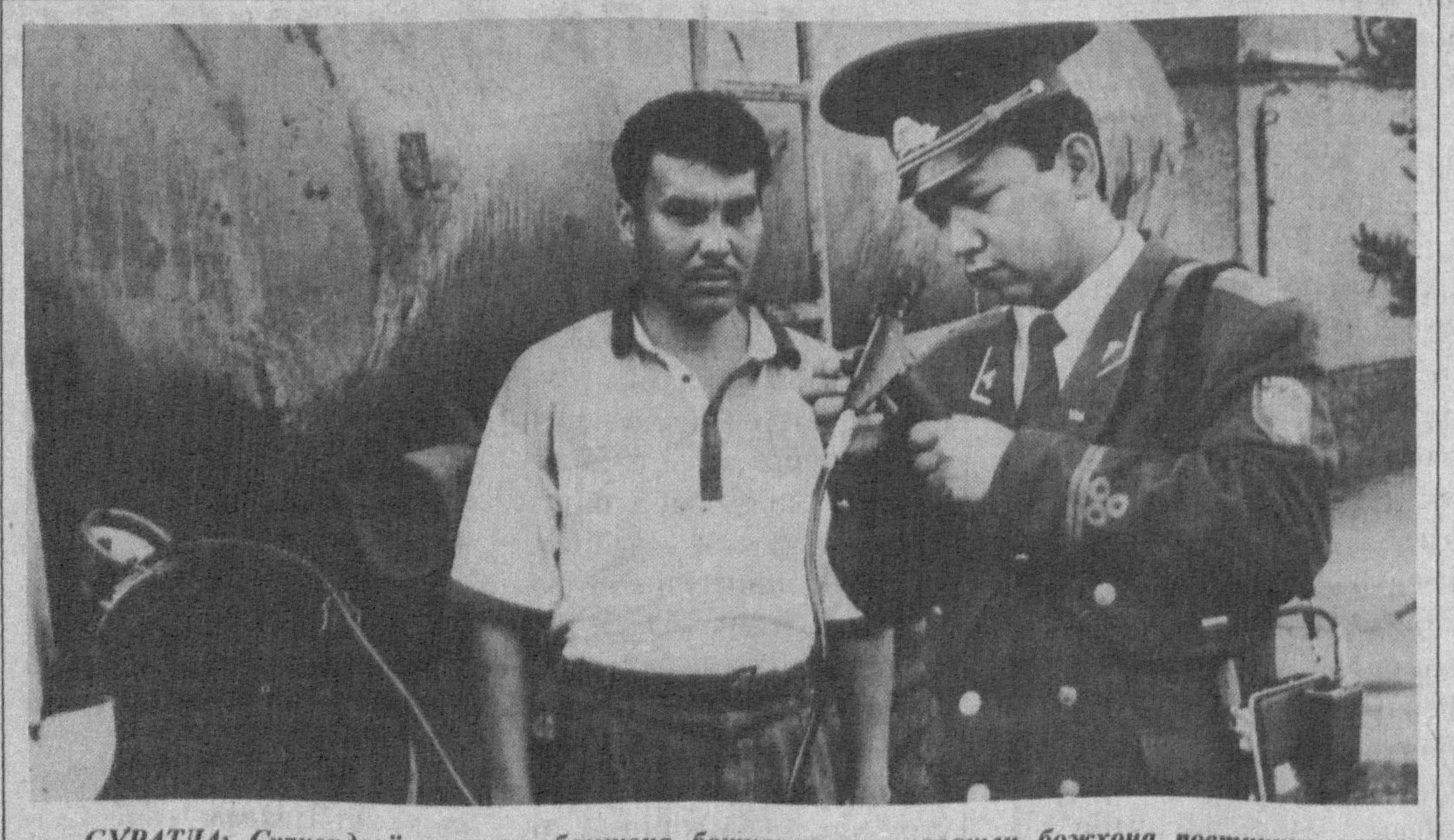
СУРАТДА: Сурхондарё вилояти божхона бошқармасига қарашли божхона постининг назир республикамиздан олиб чиқиб кетилаётган ёнгили ташиш воситасини текширувдан ўтказмоқда.

*** Сурдарё вилояти 5-сонли «Мирзобод» божхона маска-ни ҳодимлари томонидан Қоз-ғонист Республикасига ўтаёт-ган «КамАЗ-5320» русумли, давлат белгиси 67-60 СИО ва давлат белгиси 25-81 СИМ авто-уловлари тўхталиганда, ҳайдовчилар Б.П. ва А.Ж.лар