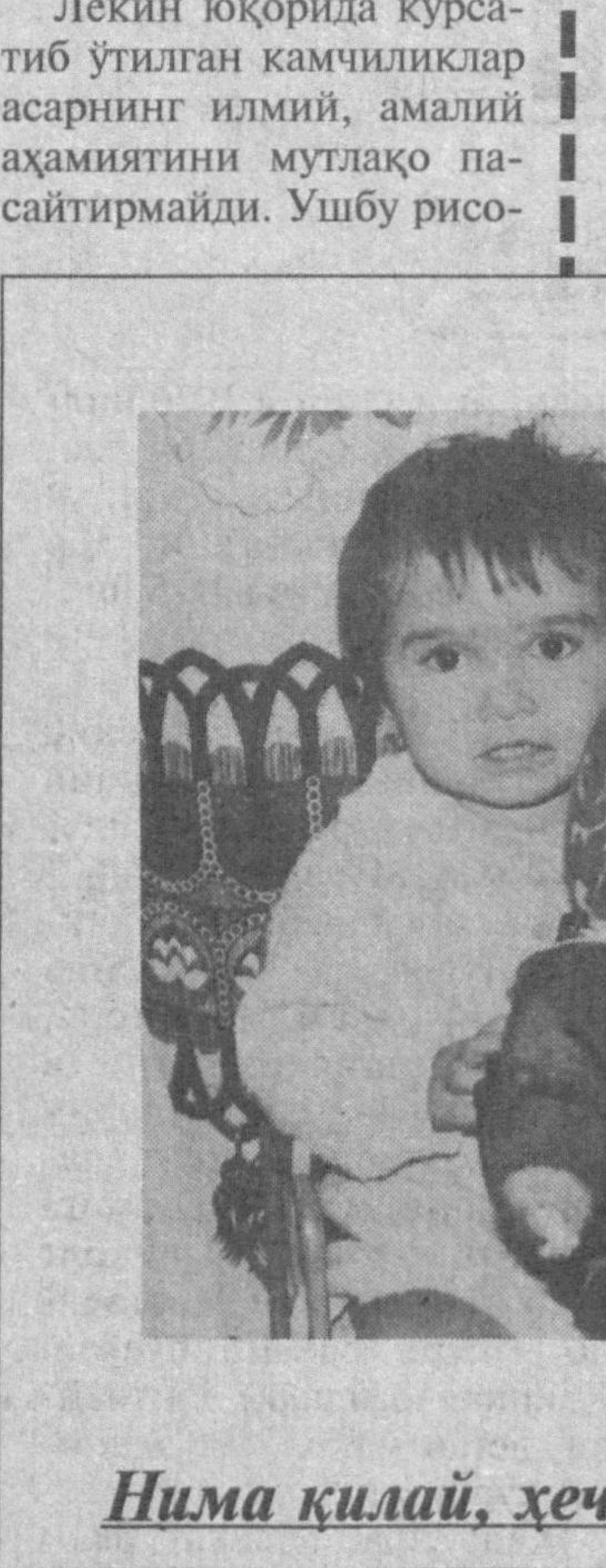
Нима қилай, ҳеч ухламаяпти...

Лекин юқорида кўрсати- б ўтилган камчиликлар асарнинг илмий, амалий аҳамиятини муздақо пай- сайтирмайди. Ушбу рисо-