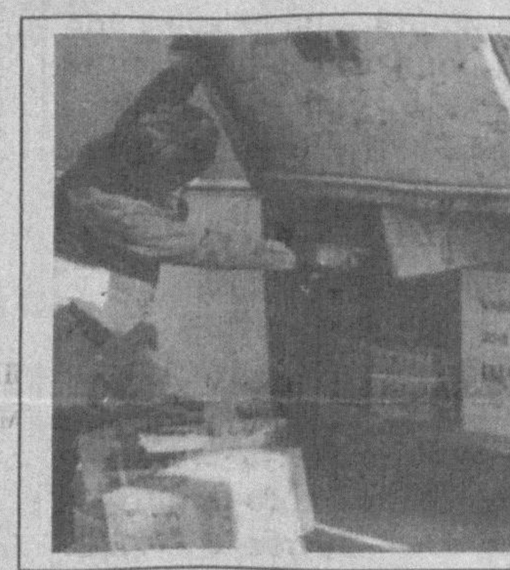
Raqamlar tilga kirganda:

Биз Тошкент вилояти божхона тизимининг 21 та «лар-воза»си борлигини биламиз. Хўш, улар қандай болган? Ишининг умумий мутаносиблиги маъжудми, деган саволларга жавоб топиш ниятида Тошкент вилояти божхона бошқармаси навбатчилик қисмида бўлдик. Бу ерда иш доимо кизгин. Кеча билан