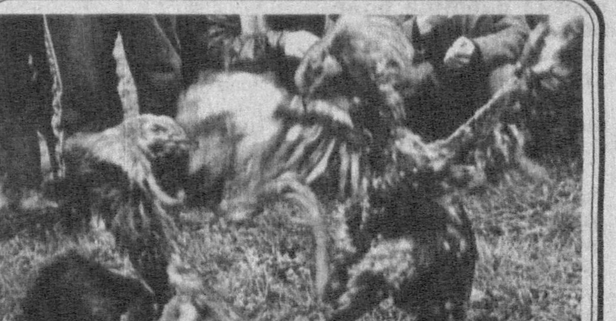
Одамлар уришмаса бўлгани...