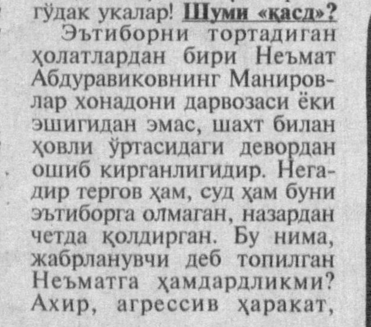
Одамлар уришмаса бўлгани...