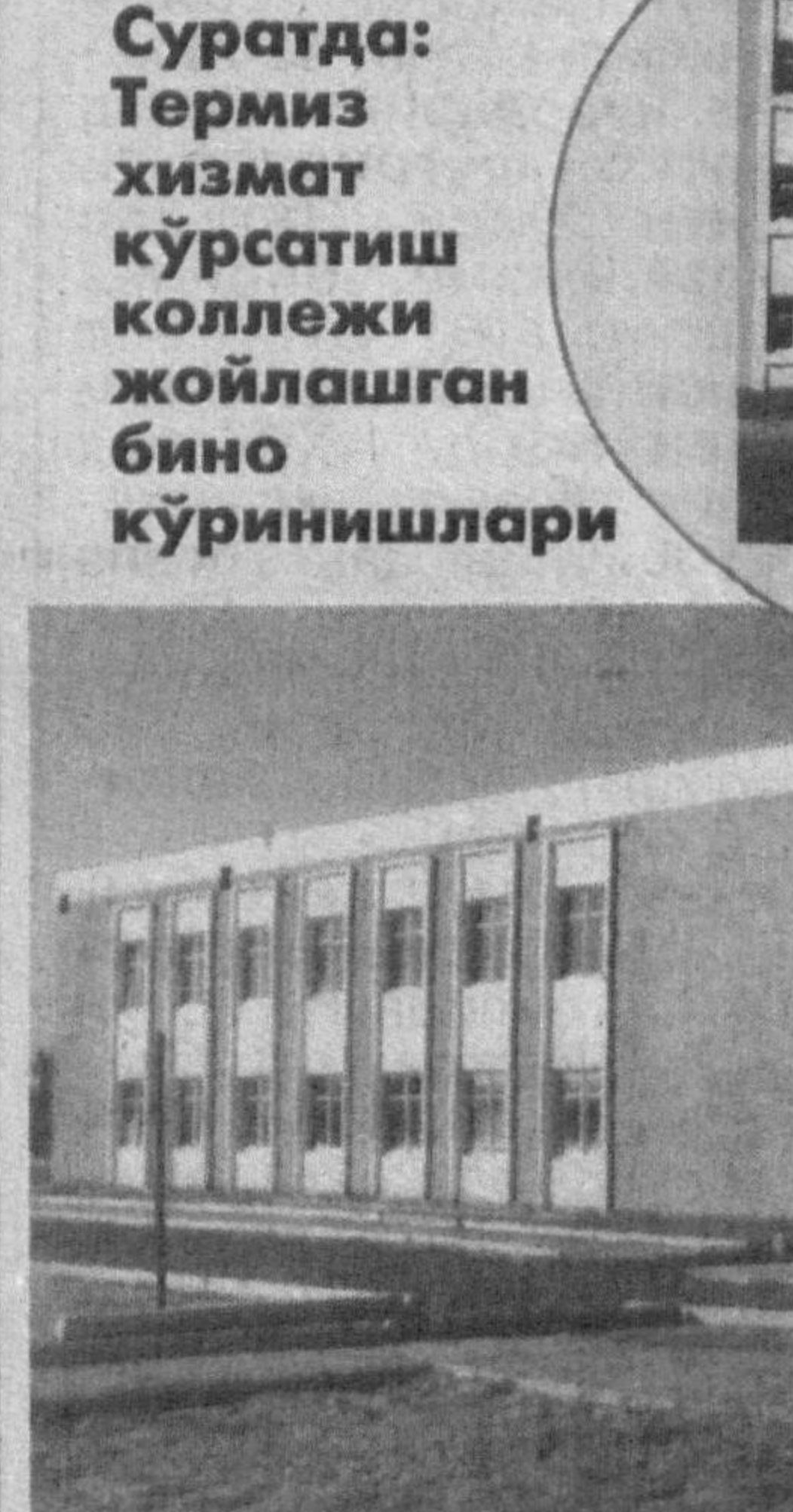
Суратда: Термиз хизмат кўрсатиш коллежи коллежга қўйилган бино кўринишлари