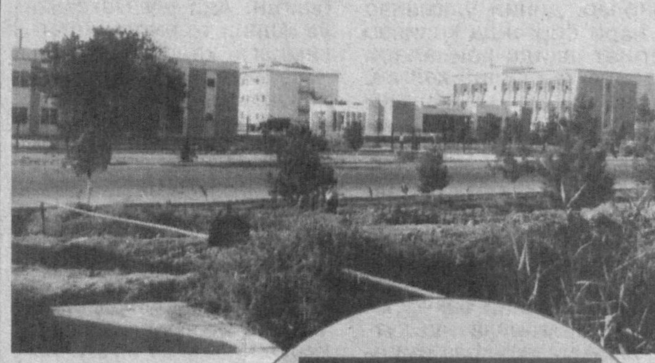
Суратда: Термиз хизмат кўрсатиш коллежи коллежга қўйилган бино кўринишлари

чиларимизнинг бир қисмини ҳали у ерга, ҳали бу ерга олиб кета бошладилар. Мен қарши қилдим. Вилоят раҳбарларига ёрдам сўраб бордим. Мана улар қўшамада қурилиш-таъмир ишлари ўз вақтида якунланди.