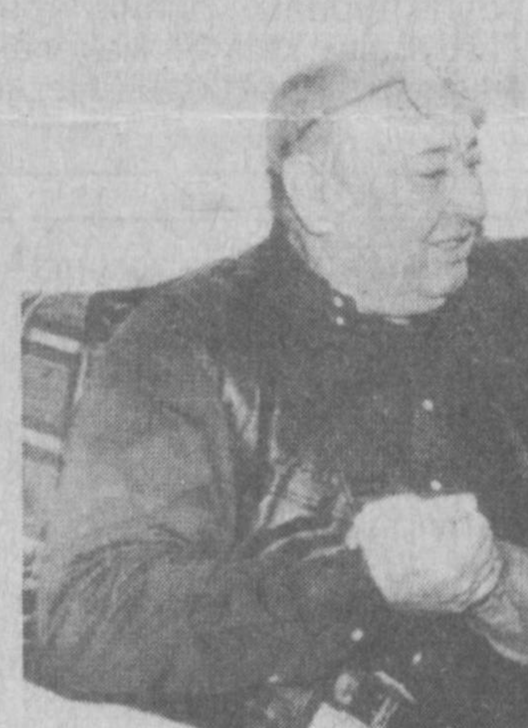
Менга қара, адаш, ҳозирги гапларни ҳеч ким эшитмасин-а? Келишдикми? Келишдик, амаки! Уғил бола битта гапларида!

Қани энди шундай шароит бўлса... Ўша образда юриб, ўша образда яшаб, кейин сахнага чиқасак... Энди Миронов битта образни маромида ижро этиш учун қанча вақт керак бўлса ҳам бошқа ишларни четга суриб, фақат шу билан банд бўлгандин. Биз эса бир кунда беш-ўн та томонга бўлиниб кетишимизга тўғри келади. Кейин кийим, жиҳозлар деярсиз, биз кийимни премьерга бир-икки кун қолганда оламиз. Беш-ўн мартаба ўша кийимда чиқ-