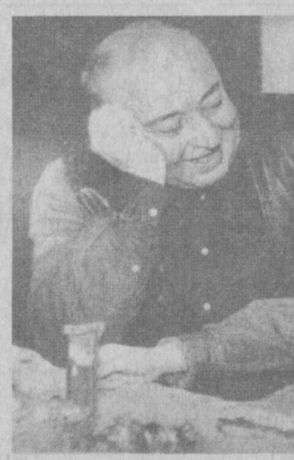
...У даврлардаги ишқ-муҳаббат бошқача бўларди... Бир кун...

Санъатга, театрга болалигингиздан қизиқанми? - Болалигимда ойимлар бир марта қўғирчоқ театрига олиб борганлари эсимда. Ушундан қўғирчоқ театри менга ёқмаганди.