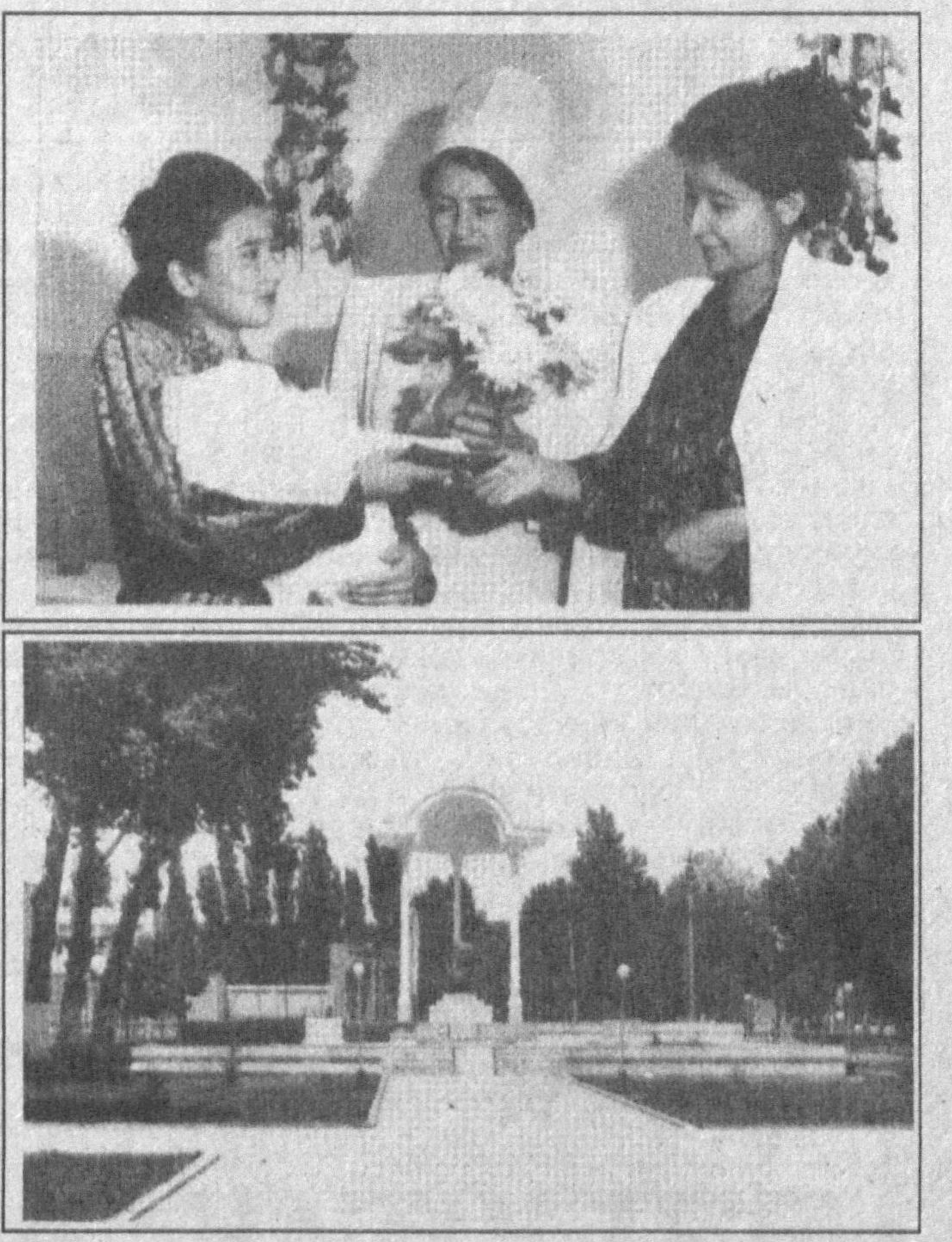
Яқинда Фарғона вилояти Учкўприк тумани марказида вилоят адлия бошқармаси ва Учкўприк тумани ҳокимлигининг яқиндан ёрдами билан замон талабларига мос "Бахт уйи" қурилиб, фойдаланишга топширилди.