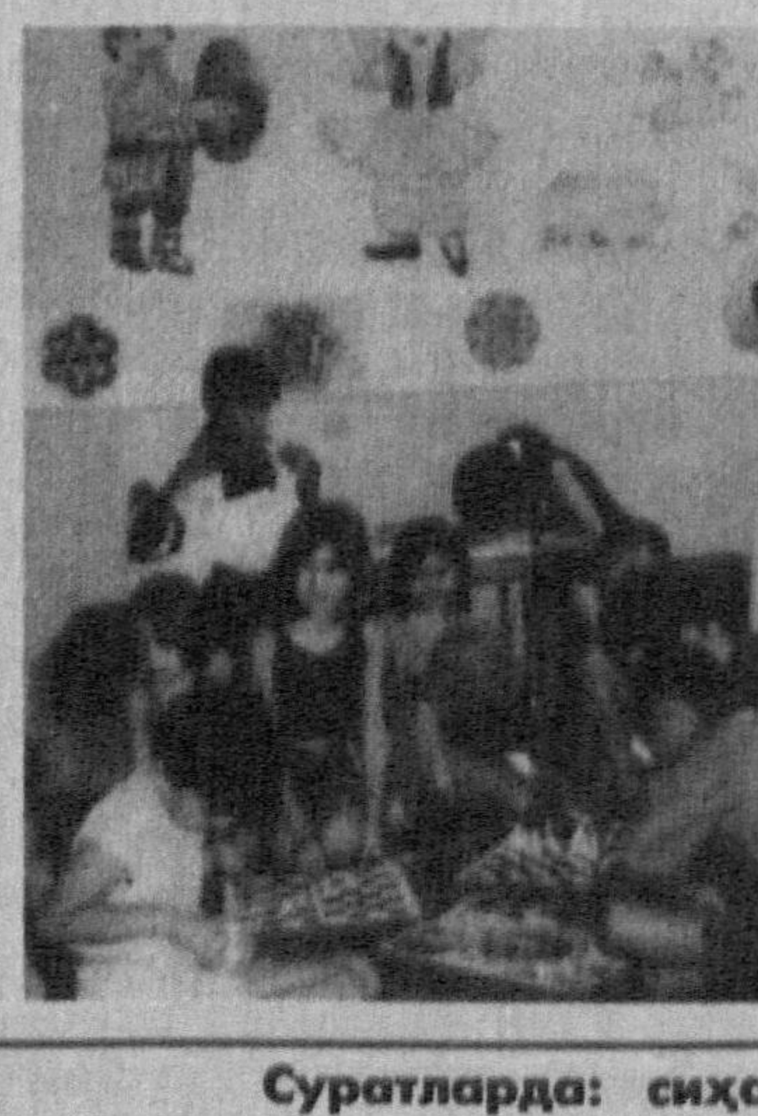
Суратларда: сийхатгоҳ ҳайтидан лавҳалар.