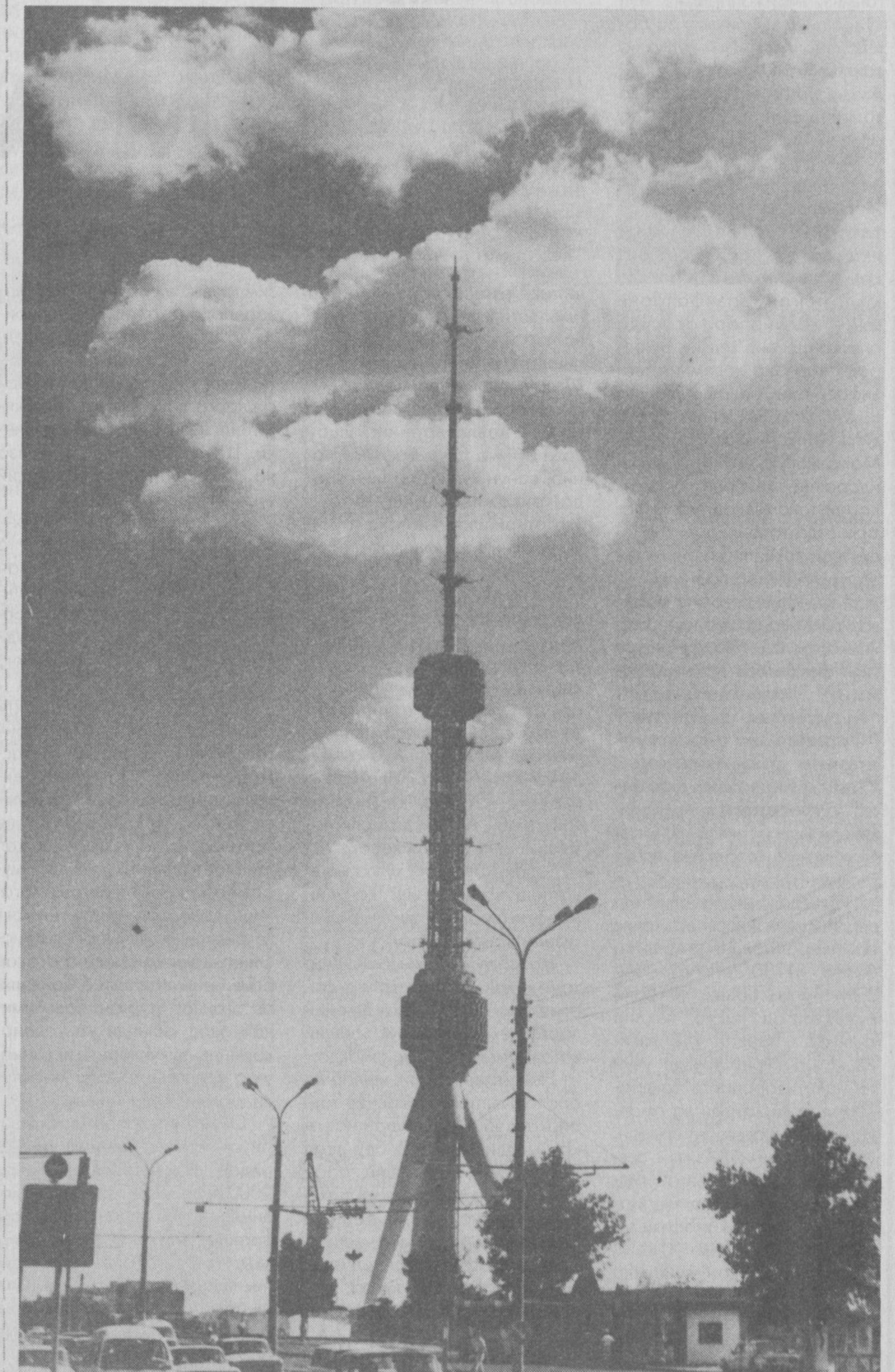
Ўзгача бир нур сочар қуёш - Наҳорлари гўзал Тошкентнинг. Булутларга ҳамсоя, сирдош Минорлари гўзал Тошкентнинг.

Ўзбекистон Республикаси Олий ҳўжалик судида 22-23 феврал кунлари, ушбу идоранинг ташаббуси билан Германия техник ҳамкорлик жамияти ҳамда Россия Федерацияси