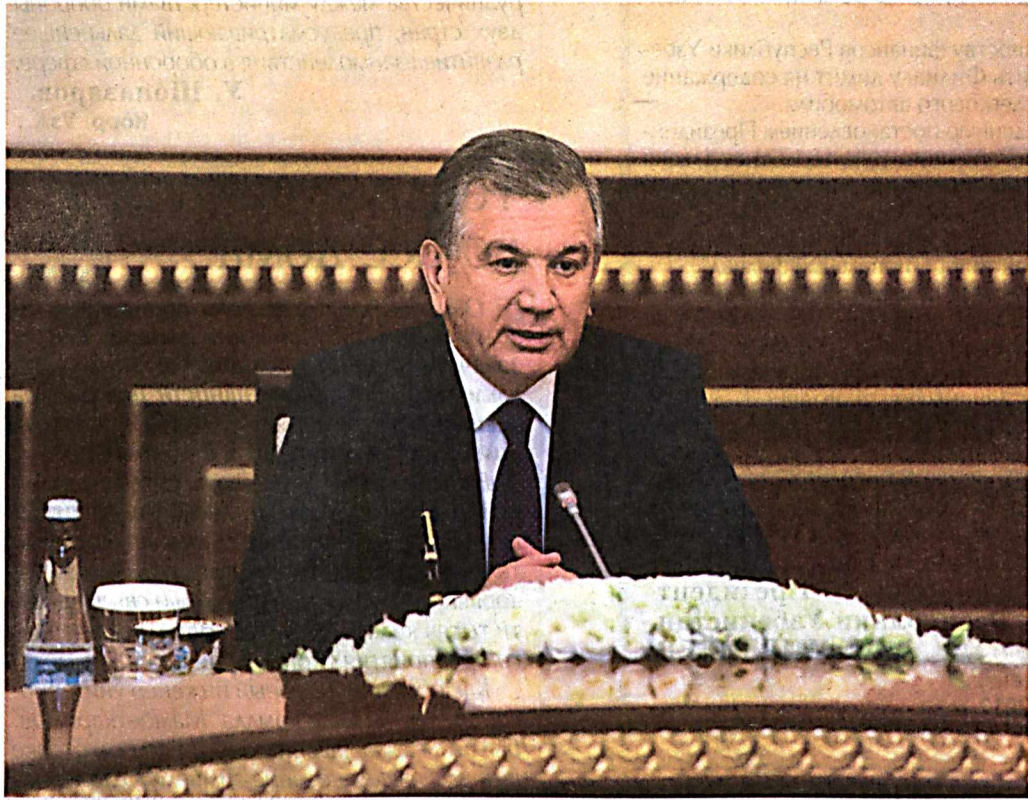
Президент Республики Узбекистан Шавкат Мирзиёев 17 августа принял министра обороны Республики Казахстан Сакена Жасузакова, находящегося в нашей стране с официальным визитом.

Глава нашего государства, приветствуя гостя, с глубоким удовлетворением отметил динамично развивающееся плодотворное сотрудничество между двумя нашими странами. Было подчеркнуто, что благодаря регулярным контактам на высшем