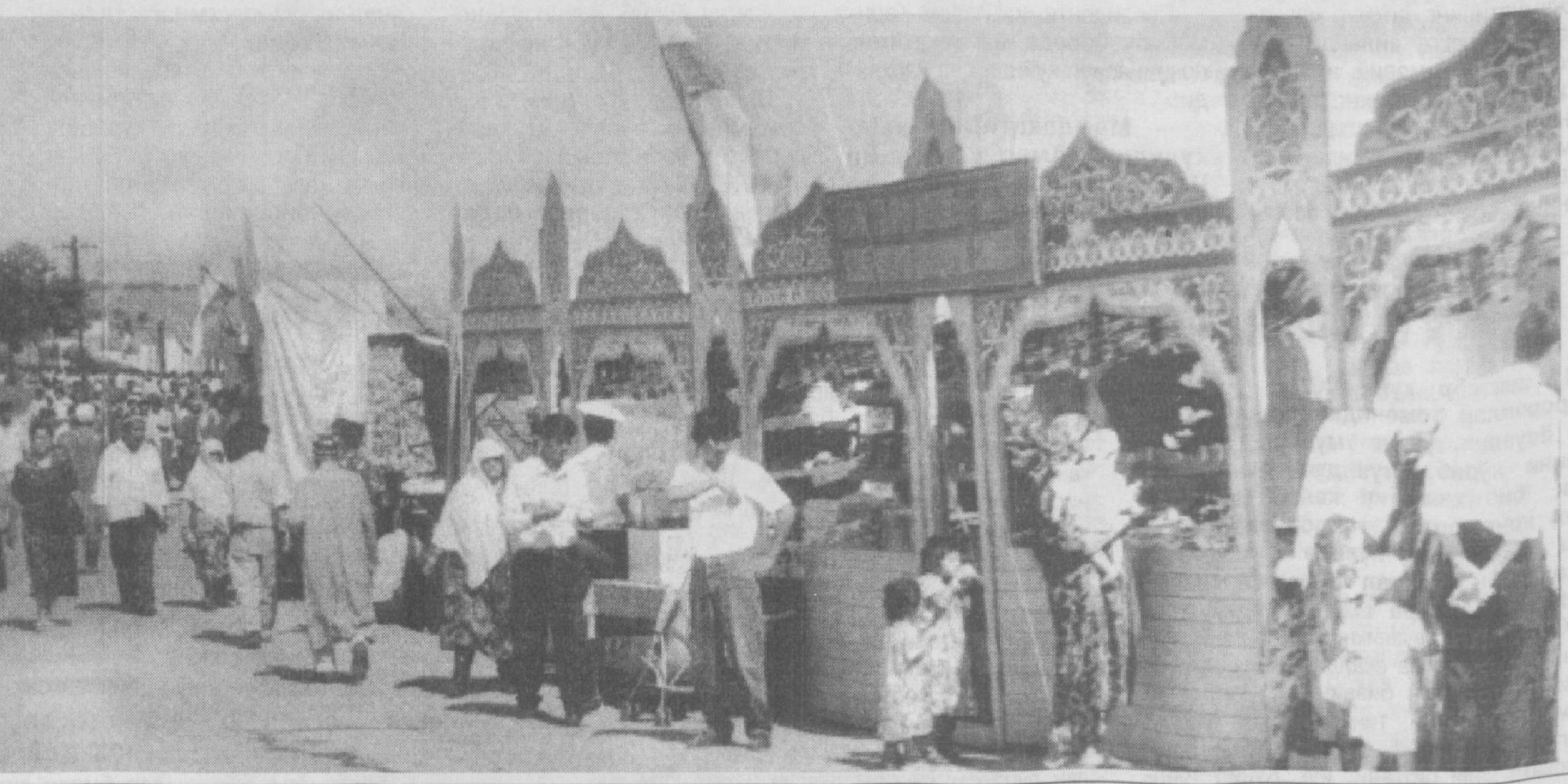
Бозорлар — юрт кўрки