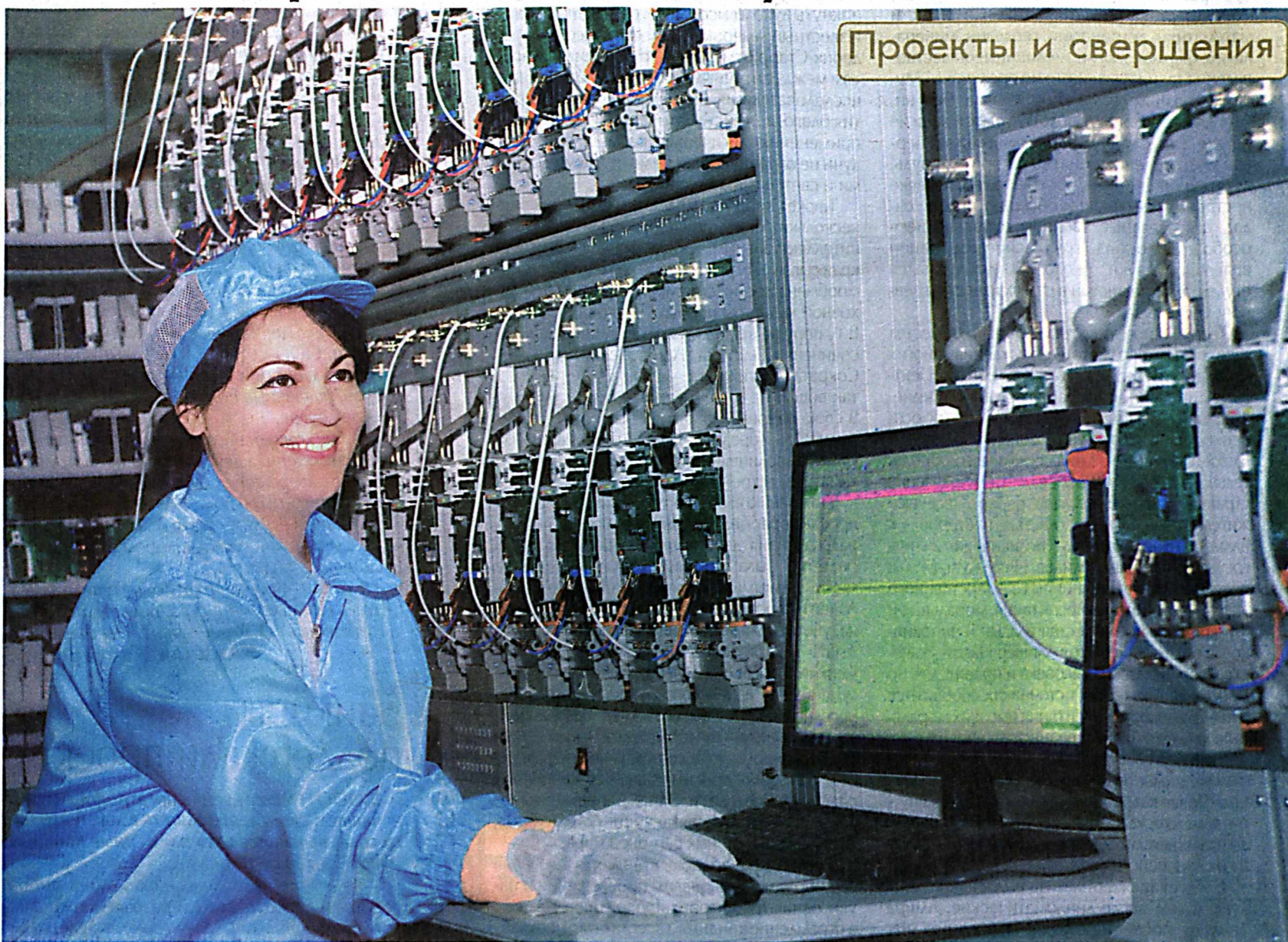
Проекты и свершения

■ С 50 тысяч до одного миллиона в год возрастает выпуск приборов учета электроэнергии на ИП ООО "Тошэлектроаппарат". Как достигли такой мощности на предприятии?