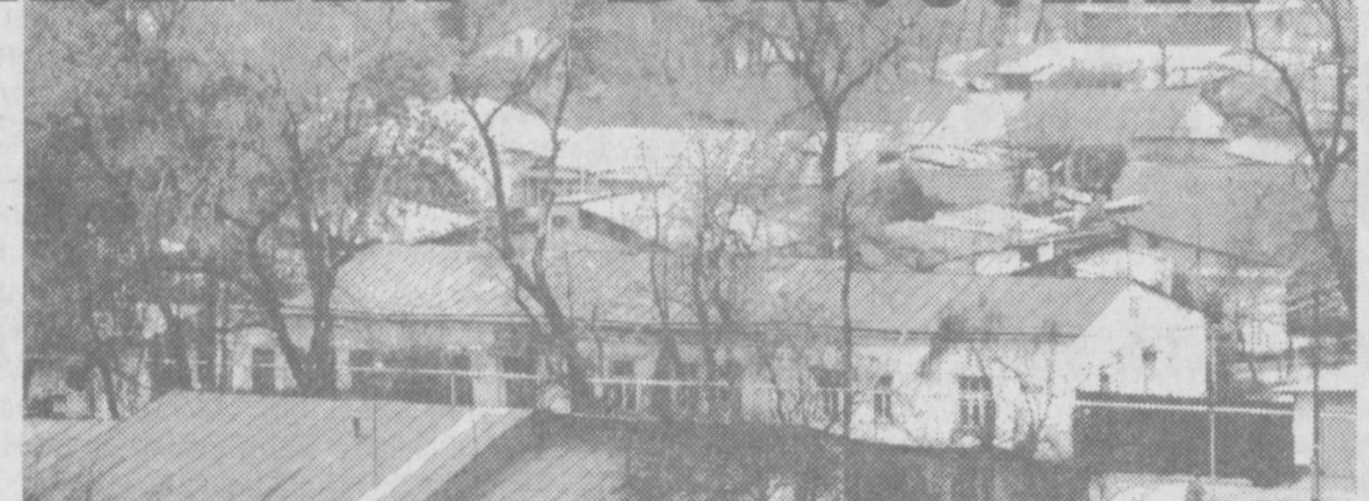
новйохоналар ва бозорчаларда савдо-сотиқ билан шуғулланган тадбиркорлардан кунига 200 сўмдан йиғим йиғилиб, маҳалла жамғармасига топшириб белгиланган.

транспорт воситаларидан 200-500 сўм миқдорда пул ундираётган маълум бўлди. Улардан мазкур ҳолатга тушунтириш бериш сўралганда, Тошкент тумани «Фишткўприк» маҳалла фуқаролар йиғини кенгашининг 2003 йил 17 декабрдаги 1-сонли баённомасини тақдим этишди. Мазкур ҳужжатни рўқас қилиб, фуқаролар ўзлари истиқомат қилаётган ҳудудни суъний равишда автоуловлар тўхташ жойига айлантиришга уринмоқда.