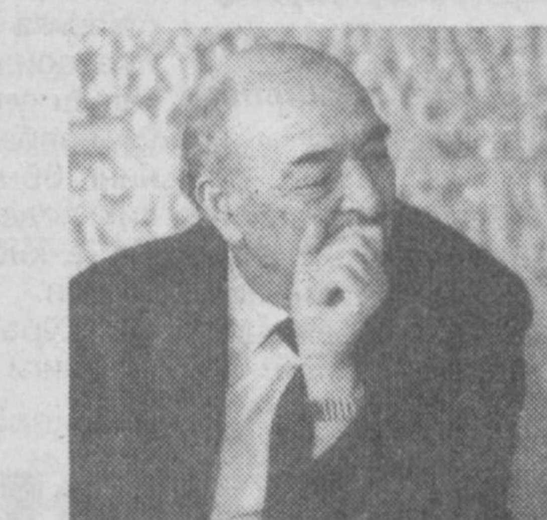
Озод ШАРАФИДДИНОВ, Ўзбекистон Қаҳрамони

Мана, XXI асрнинг тўртинчи йили ҳам эсон-омон яқунлаб олдик. Назаримда, 2004 йил халқимиз учун, юртимиз учун қўлғу йил бўлди.