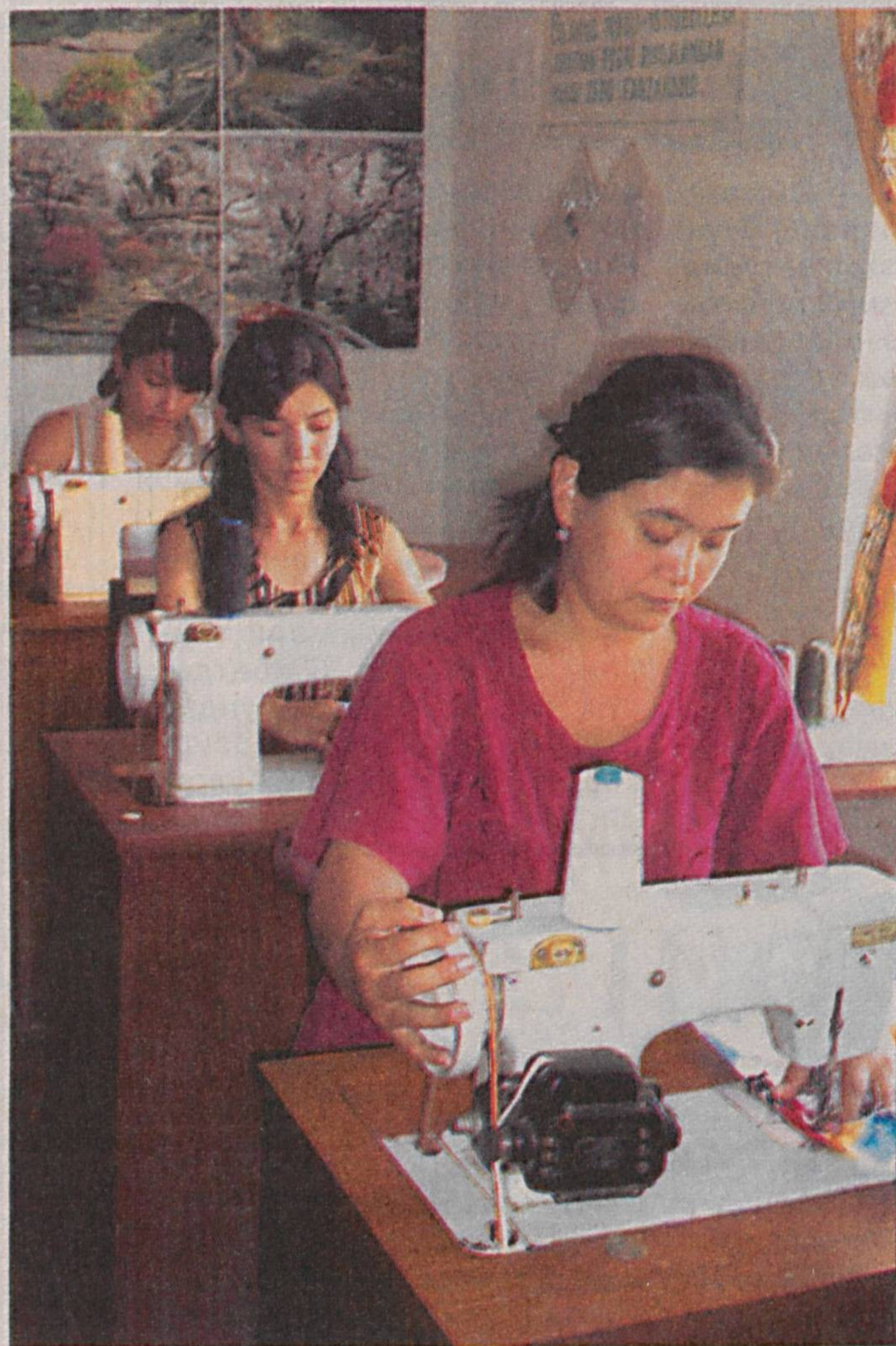
Юртдошим, боғинга бир ниҳол қада, Бу ниҳол номини яхшилик ата...