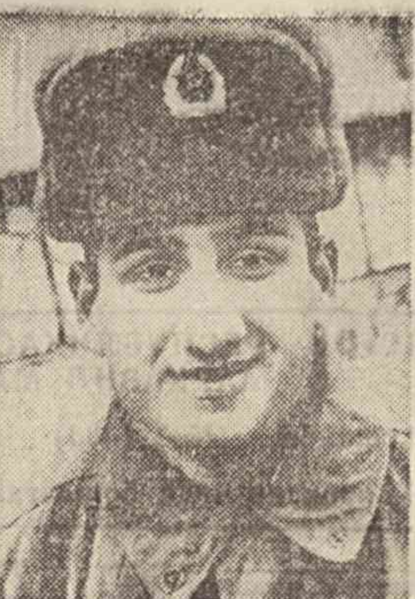
қилмоқликлари ҳам фарз, ҳам қарз эканлиғи ҳақида ўқитиб бораётганлар.

кўнун ишон кўрсатиши билан бахтли киши бўлмас экан. — Мустақиллик қилишда кенгайлашган ватанпарварлик руҳида тарбиялаш ишига катта аҳамият қаратишмоқда. Мунтазам кўрсатилаётган ўқувлар, унга ёзувчи ва шонрлар, ҳуқуқшунос олимлар, захирдаги ва истефодоли офицерлар, уруш ва меҳнат фахрийлари,