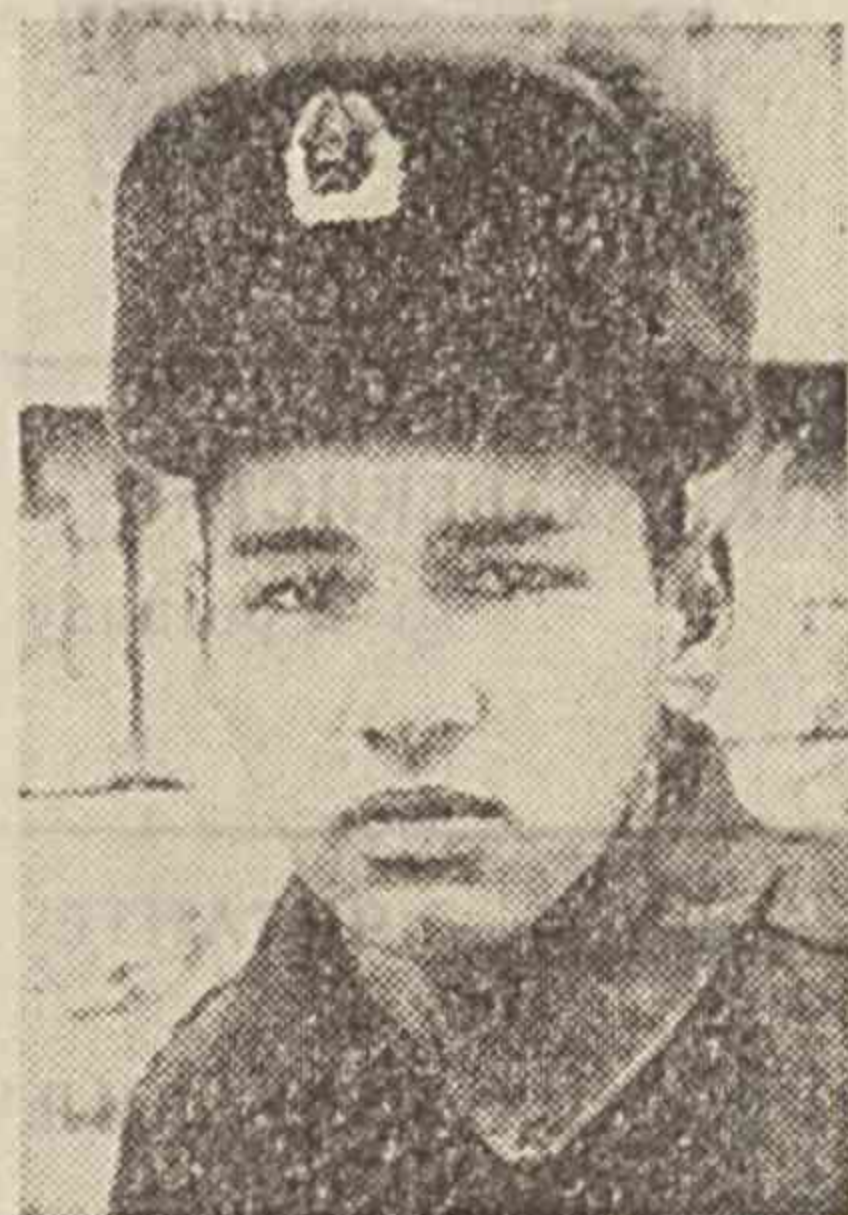
Бўлима кўни ўтказилар экан, унинг ҳар бир аъзоси ўз қисмига ўзига ягона савоб билан мурожаат қилаётгандай. «Мен мундадас бурччиёни бажарар эканман, бўлимадаги оғуриқим билан тугитиш учун шу кунга қадар талаб даражасида хизмат қила олдимми?»

ХИМОЯМИЗ қаҳрамонлари хизмат қилаётган бўлимада ажойиб айбонлар мавжуд. Чунончи, бўлима ташкил толган кунинг ҳар йили тантанали қийфатда байрам қилиниши ҳам ана шу айбонлардан биридир. Албатта, бундан кўзланган мақсаднинг қамрови кенг, унуми катта.