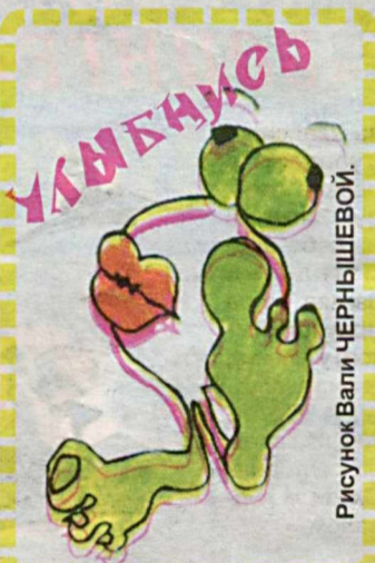
Рисунок Вали ЧЕРНЫШЕВОЙ.