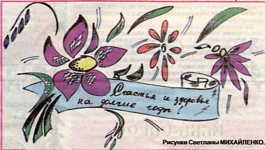
Рисунки Светланы МИХАЙЛЕНКО.