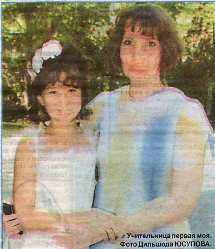
Учительница первая моя.