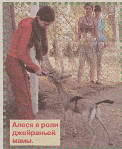
Алеся в роли джейраньей мамы.