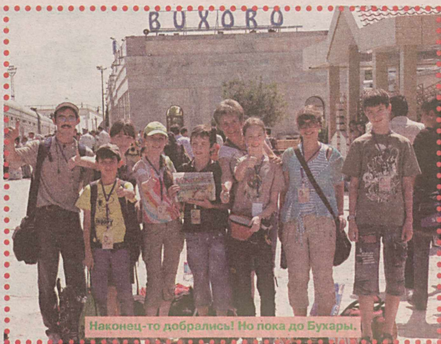
Наконец-то добрались! Но пока до Бухары.