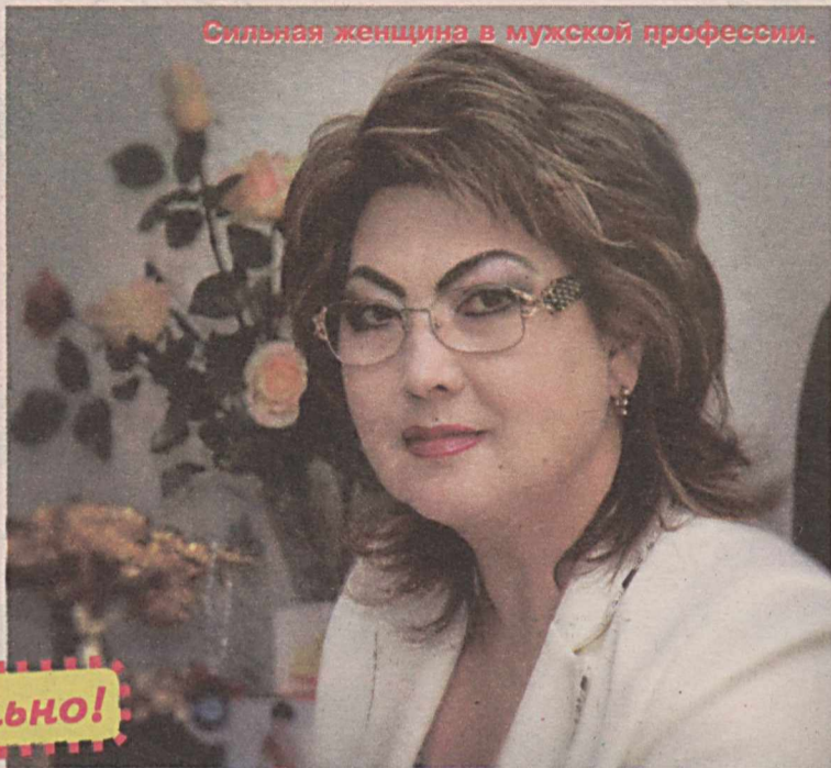
Сильная женщина в мужской профессии.

Разнообразные и очень востребованные специальности! Но, как выяснилось, неохота ребятам расставаться с родным колледжем. Жизнь здесь интересная и разнообразная. Работают 72 кружка! Большое внимание уделяется спорту, здесь учатся 11 чемпионов мира по разным видам спорта. А ученическая форма – единая для всех, очень красивая, солидная такая – похожа на прокурорскую. И особо поддерживаются одарённые ребята: будь то компьютерный гений