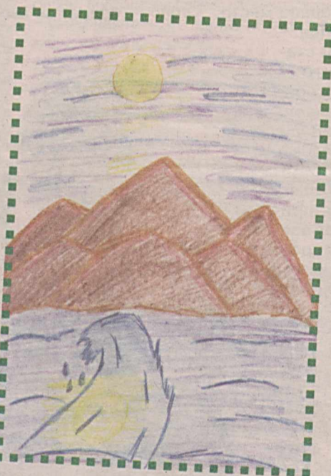
Рисунки Ангелины ВЕГНЕР, 9 лет.