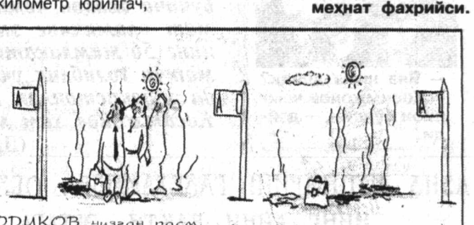
Х.СОДУҚОВ чизган расм.