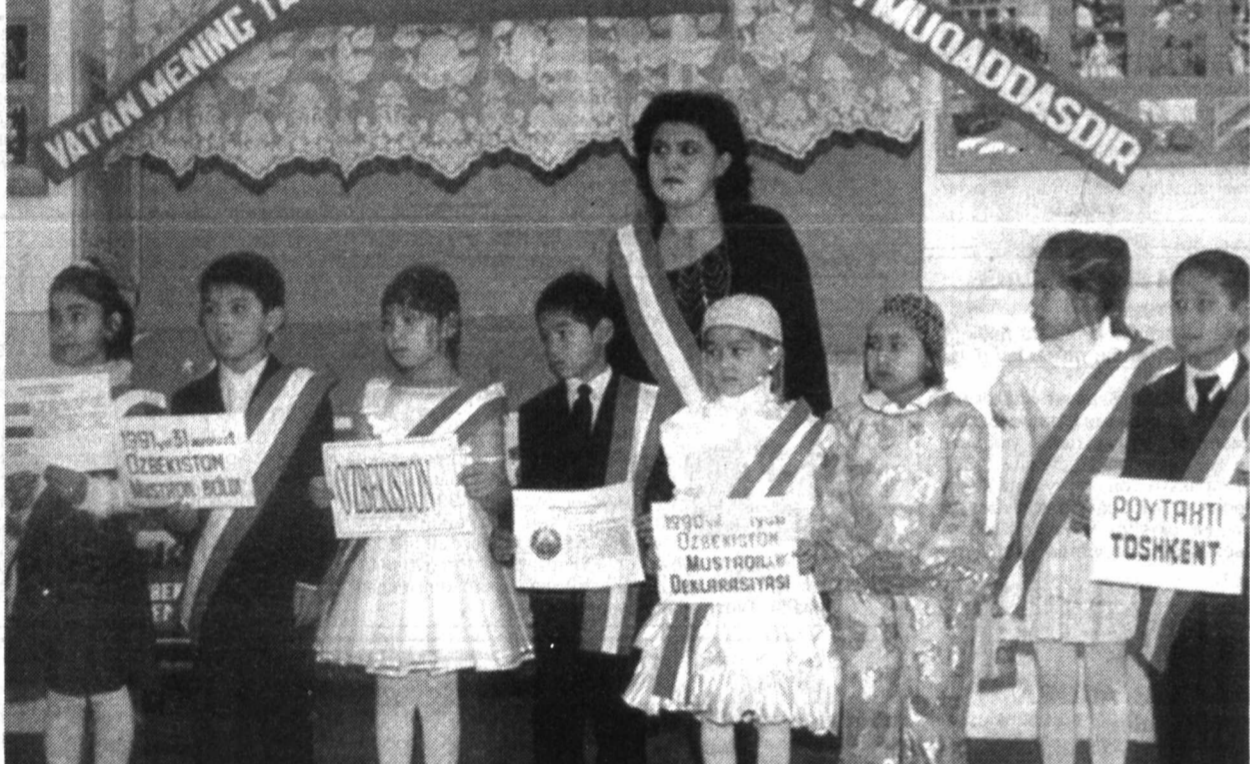
Пойтахтимизнинг Сергели тумани Қумариқ маҳалласидаги 269-мактабда 8 декабрь — Ўзбекистон Конституцияси кунини ва 10 декабрь — Ўзбекистон Давлат мадҳияси қабул қилинган кун муноабати билан катта тантана уюштирилди. Мактаб ўқувчилари тadbирга таширф буюрган ота-оналар ва мураббий-ўқитувчилари учун Ватанимиз тарихига оид, миллий қадриятларимизни эсга элттирувчи саҳна кўринишларини намойиш этдилар, қўшиқлар куйлаб, рақсга тушдилар.