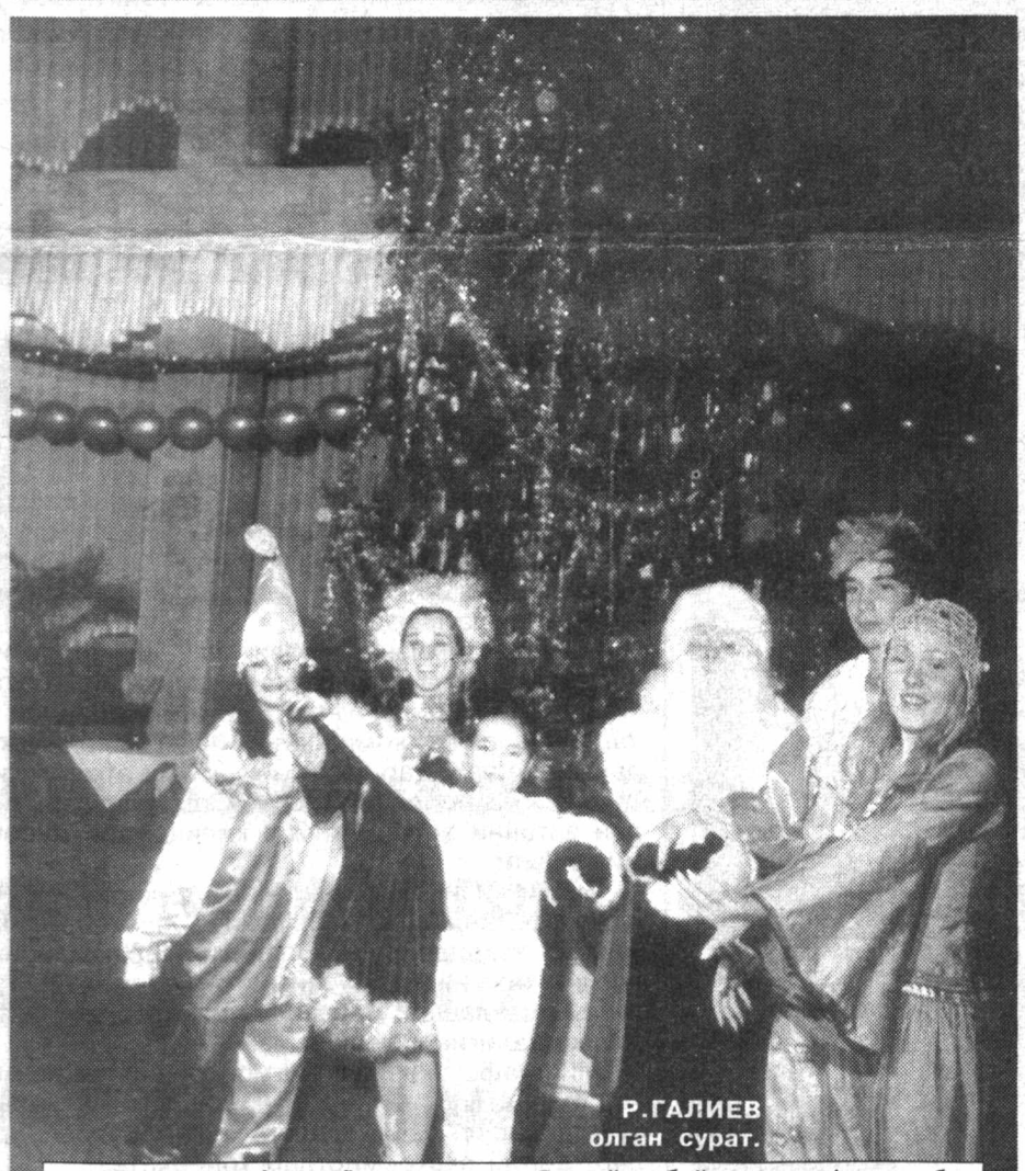
Р. ГАЛИЕВ олган сурат.

"Президент Арчаси" тантаналари Янги йил байрами арафасида болажонларимиз қалбига олам-олам қувонч бахш этувчи анъанавий тадбирга айланганига кўп йил бўлди. Ушбу йилда ҳам бу анъана давом этди, Меҳрибонлик уйлари тарбияланувчилари ва кам таъминланган кўп болали оилалар фарзандлари "Президент Арчаси" атрофида жам бўладилар. Бугун бу тантана пойтахтдаги мухташам "Халқлар дўстлиги" саройида ўрнатилган баланддан-баланд "Президент Арчаси" атрофида янги йил томошаси билан бошланади. Вилоятларда ҳам бу тантаналар давом этади.