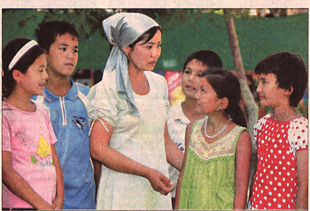
Анджон вилоятида шаҳар четидати 19 та оромгоҳда 9 минг 630 нафар ўқувчи, шунингдек 38 та мактаб қошдаги кундузги дам олиш оромгоҳларида 9 минг нафар бола ёғти тағйили мазмуни ва мароқли ўтказмоқда.

Пахтаобод тумани Учқўза болалар оромгоҳида 600 дам олиш мактаб ўқувчилари дам олади. Шинма ётоқхоналар, охиона, спорт майдони, бассейн, кутубхона болажонлар ихтиёрида.