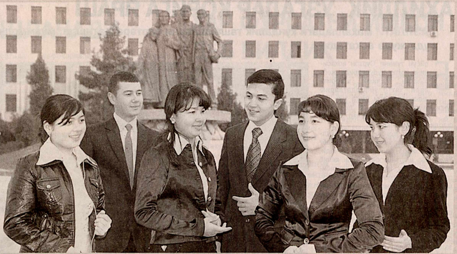
Қарши маданият коллежи талабалари «Эл-юрт таянчи» монументи олдида

Ёшлар юртнинг эртаси. Уларни комил инсонлар этиб тарбиялаш борасида Қашқадарё вилоятида ҳам эзгу ва хайрли ишлар амалга оширилмоқда. Биргина Қарши шаҳридаги маданият коллежида бу борада олиб борилаётган ишлар эътиборга молик.