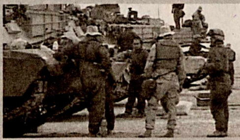
билан шугулланади. 2011 йилнинг декабрига келиб эса АҚШ армияси мамлакатни бутунлай тарк этади.

Август ойининг охирига бориб Ироқда Пентагоннинг 50 минг нафар аскари қолади, 90 минг нафари эса уйларига қайтади. Қолган харбийлар асосан Ироқ армиясини қайтадан тайёрлаш ва аскарларнинг жанговарлик қобилиятини оширишга қўмаклашиш