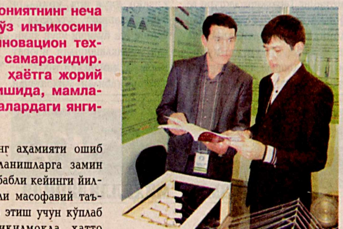
ҳолда етук мутахассис бўлиб етиштириларида муҳим аҳамият касб этади.

лари ва интернетнинг аҳамияти ошиб бораётгани бу янгиланишларга замин ҳозирламоқда. Шу сабабли кейинги йилларда интернет орқали масофавий таълим тизимини жорий этиш учун кўплаб дастурлар ишлаб чиқилимоқда, ҳатто электрон кутубхоналар базаси ҳам яратилаётир. Бу ёшларимизнинг чуқур билдони эгаллашларида, турли китобларнинг электрон вариантдан фойдаланган