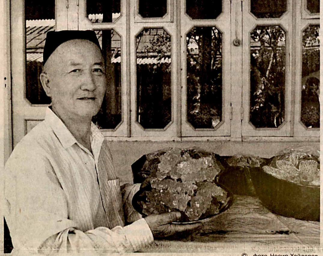
Маҳалланинг ширин новвоти