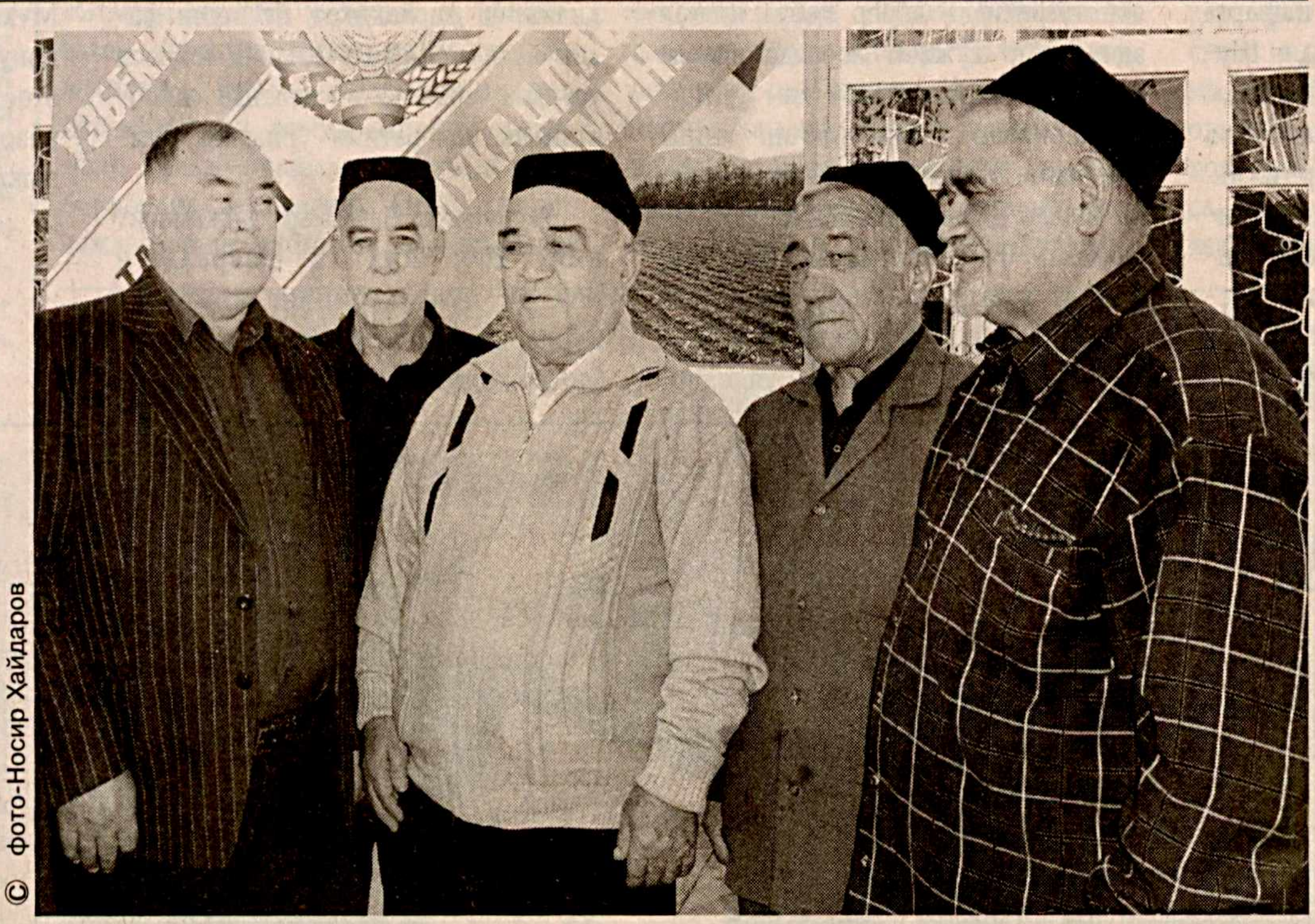
Пойтахтимизнинг Учтепа туманида жойлашган «Шофайзбоб» маҳалласи шахримизнинг обод гушларидан бири. Бу ерда ҳозирда 467 та хонадонда 4000 нафар аҳоли истиқомат қилади. Йилнинг ҳудудига ободонлаштириш ишлари кенг кўламада амалга оширилмоқда. Шу билан бир қаторда маҳалла ёшлари бўш вақтини мазмунли ўтказишлари учун яқинда спорт зали ташкил қилинди. У ерда болалар мактабдан кейин спортнинг бир неча тури билан шуғулланади.