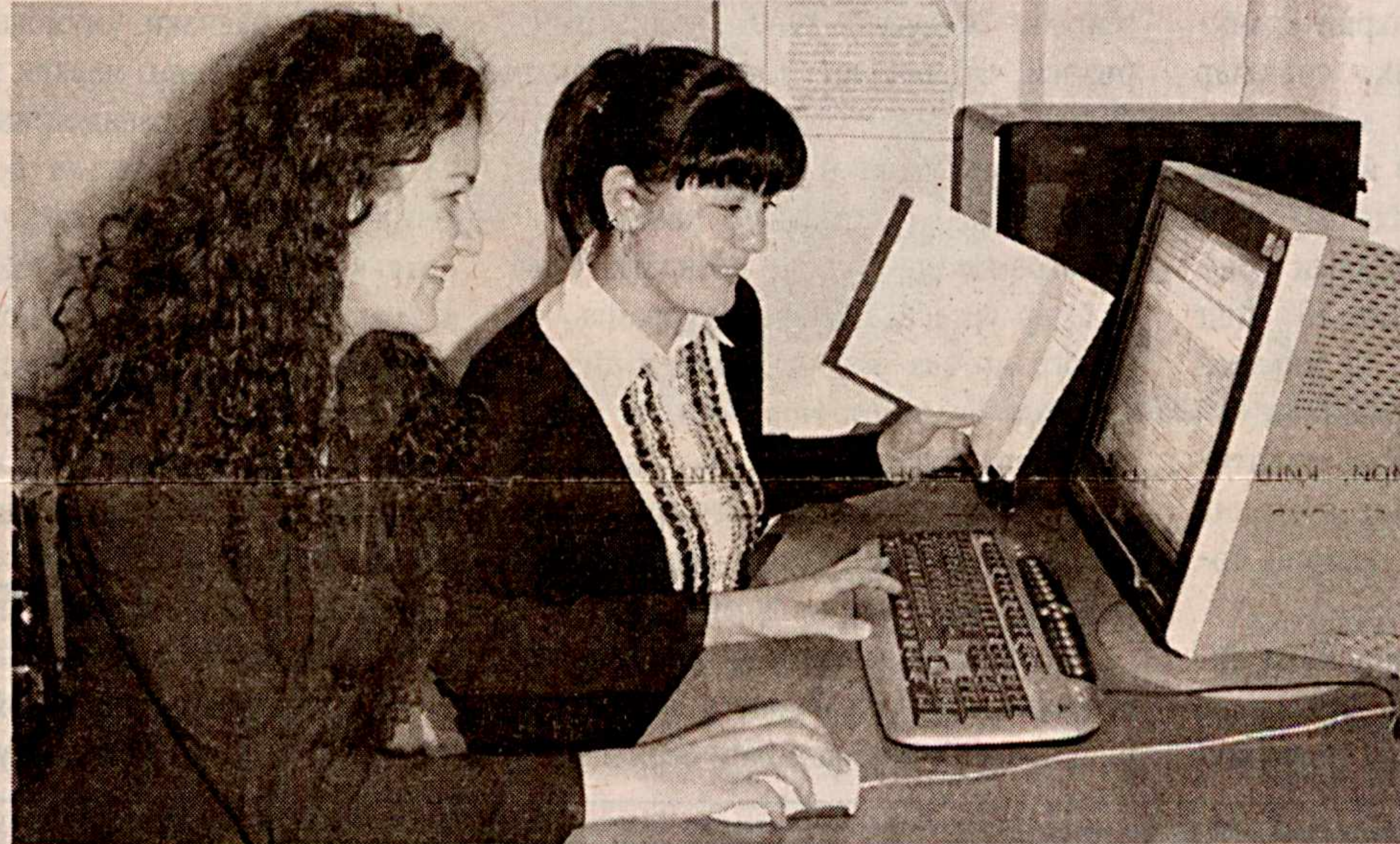
Бухоро давлат университети ҳузуридаги ахборот-ресурс марказида талаба-ёшларнинг замонавий ахборот-коммуникация технологияларидан кенг фойдаланиши учун барча шарт-шароит яратилган. Марказ 775 мингдан зиёд китоб фондига эга.

Марказнинг электрон базасига кириб, Бухоро давлат университети тарихи ва бугуни, илмий салоҳияти тўғрисидаги