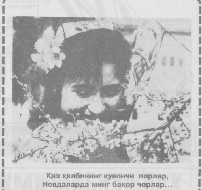
Қиз қалбининг қувончи порлар, Новдаларда минг баҳор чорлар...

рий этилди. Миллий тарих камситилди. Шовинизм қо- липига солиб ўрганилди.