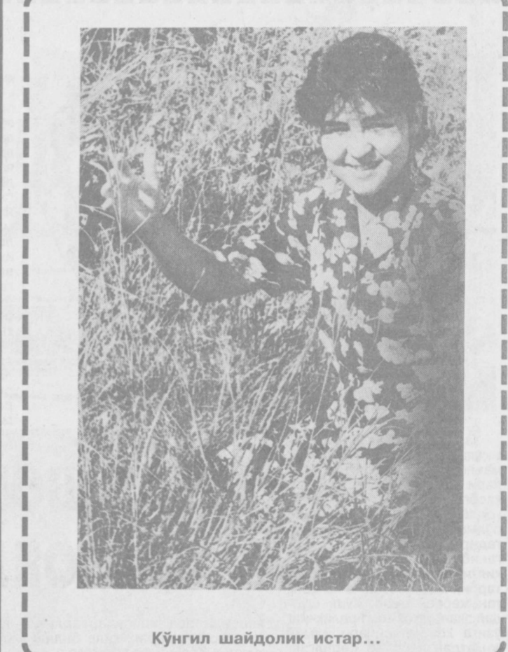
Кўнгил шайдолик истар...