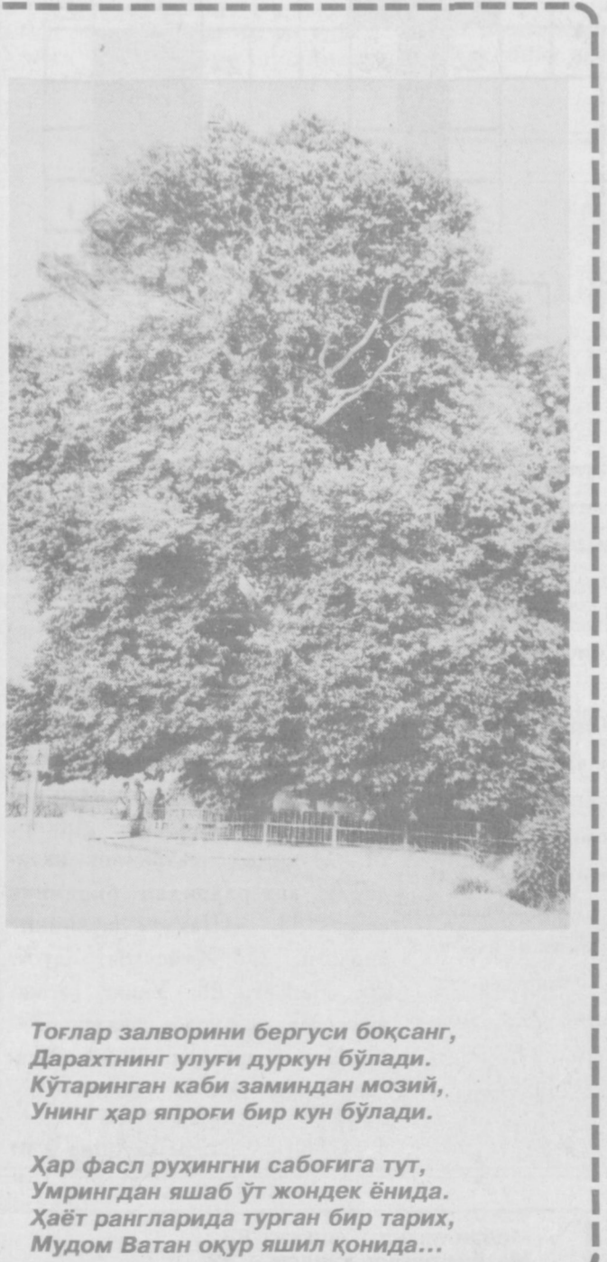
Тоғлар залворини бергуси боқсанг, Дарахнинг улуги дурқун бўлади. Кўтаринган каби заминдан мозий, Унинг ҳар япроги бир кун бўлади. Ҳар фасл руҳингни сабоғига тут, Урингдан ашаб ўт жондек ёнида. Ҳаёт рангларидан турган бир тарих, Мудом Ватан оқур яшил қонида...