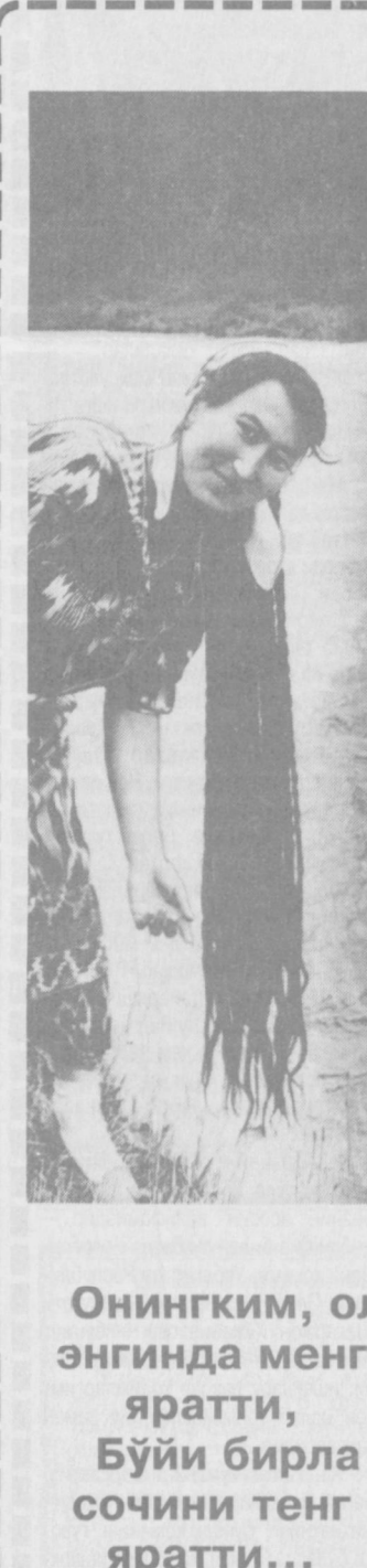
Онингким, ол энгинда менг яратти, Бўйи бирла сочини тенг яратти...