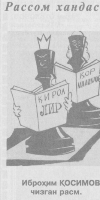
Рассом хандаси Иброҳим ҚОСИМОВ чизган расм.