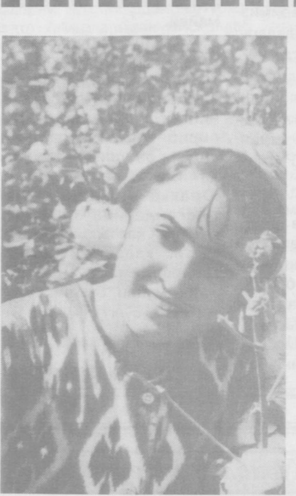
Узоқ-узоқ асрлардан турфа тарихларга елга тутиб келаятган Богот бугунги кунда...