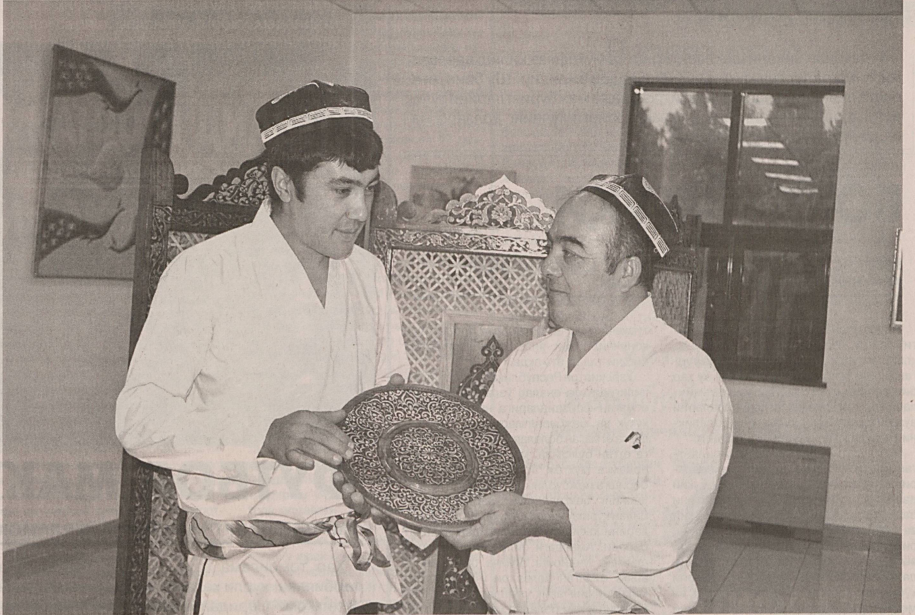
Устоз ва шогирд: анъана давом этади.