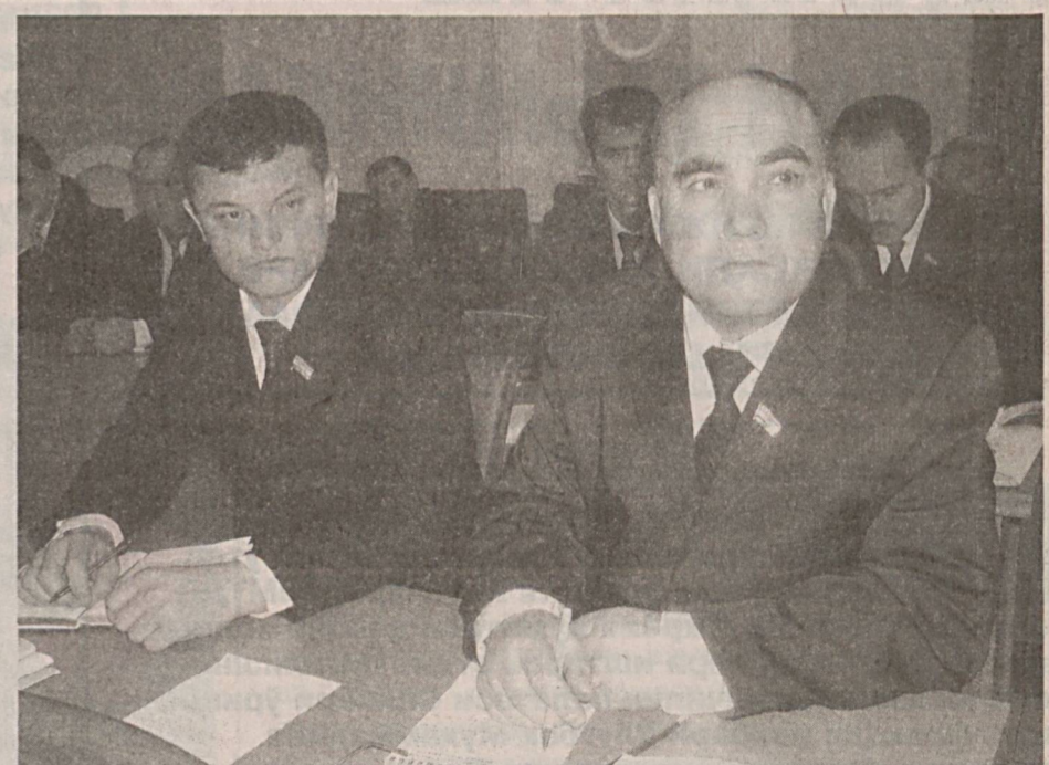
Йиғилиш муҳокамаларида иштирок этган депутатлар, тақлиф ва мулоҳазаларини Ўзбекистон "Миллий тикланиш" демократик партияси позицияси ҳамда электорат манфаат-

ҳақида»ги қонун лойиҳалари иккинчи ўқишда муҳокама қилинди. Йиғилишда шунингдек, бир қатор биринчи ўқишда киритилиши назарда тутилган қонун лойиҳалари муҳокама қилинди. "Ўзбекистон Республикаси Хўжалик процессуал кодексига ўзгартиш ва қўшимчалар киритиш тўғрисида"ги қонун лойиҳаси Хўжалик процессуал кодексига тадбиркорлик субъектларига нисбатан ҳуқуқий таъсир чораларини қўллаш билан боғлиқ низоларни кўриб чиқишнинг процессуал тартибини белгиловчи нормалар киритишни назарда тутди.