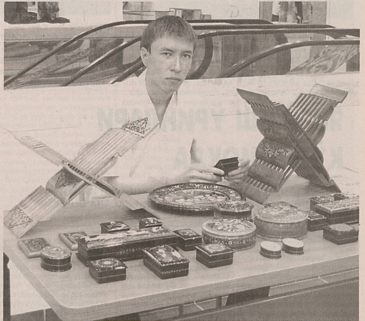
Халқ амалий санъати намуналари